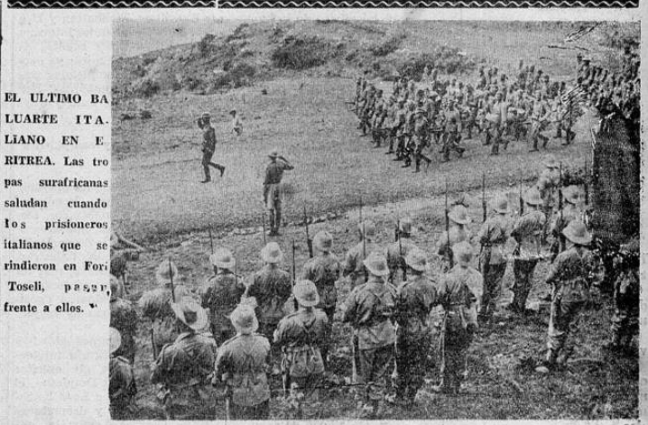
EL ULTIMO BALUARTE ITALIANO EN ETRURIA. Las tropas surafricanas saludan cuando los prisioneros italianos que se rindieron en Frontoseli, pasaron frente a ellos.

LOS ANGELES, 12.—UP.—El ex embajador norteamericano en Rusia, Joseph Davis, con testó la apreciación del ex em-