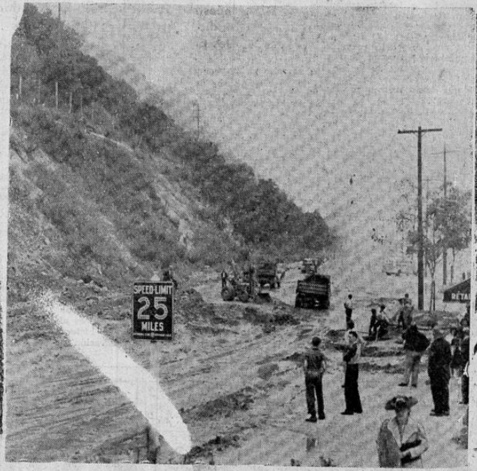
La nueva 'montaña móvil' de California, que ha estado ocasionando grandes dolores de cabeza a las autoridades norteamericanas, inutilizó esta señal de precaución en la carretera al desplomarse toneladas de tierra sobre la carretera en uno de los últimos temblores que ha expedimentado.