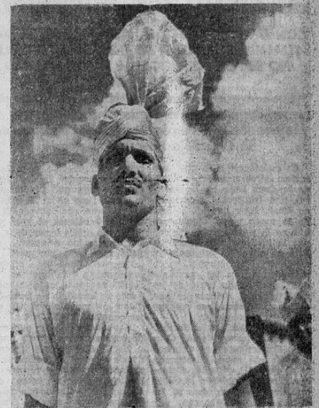
En los cien años que lleva de organizado el Cuerpo Real de Artillería de Singapur ha ido cambiando sus armas o medida que éstas han ido progresando en su construcción pero si embargo no ha abandonado sus vistosos y caprichosos gorros.