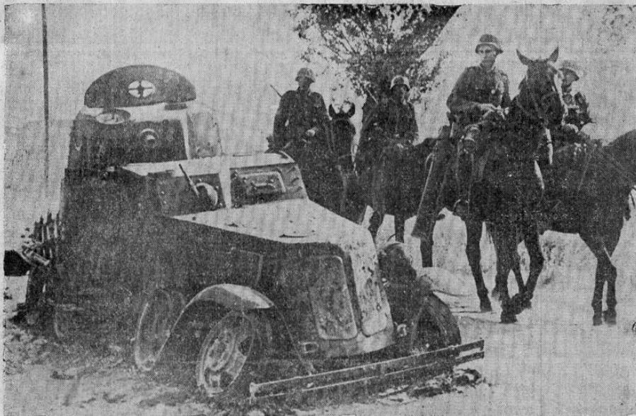
Tanque ruso, destrozado por la artillería alemana, yace a un lado de la carretera mientras un grupo de soldados de caballería alemanes pasan por su lado y observan.

LAS TROPAS DEL GENERAL TIMOSCHENKO ABRIERON BRECHA ENTRE LAS TROPAS NAZIS QUE OPERAN EN EL FRENTE CENTRAL RUSO