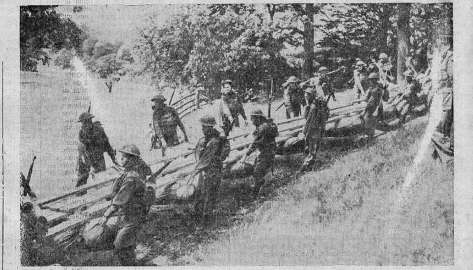
Tropas noruegas, actualmente adiestrándose en Escocia llevan un puente de urgencia para colocarlo sobre el río y permitir el paso de las tropas.