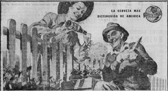
LA CERVEZA MAS DISTINGUIDA DE AMERICA