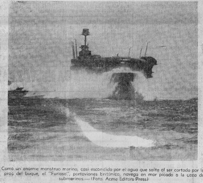
Como un enorme monstruo marino, casi escondido por el agua que salta al ser cortado por la proa del buque, el "Furioso", portaviones británico, navega en mar picado a la caza de submarinos.