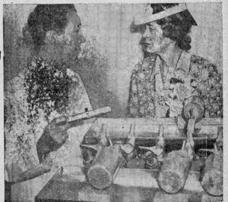
Lady Halifax, esposa del embajador de Gran Bretaña en E. U., Lord Halifax visitando un laboratorio en el que se verifica el proceso de transformación de la sangre recogida entre numerosos individuos convirtiéndola en plasma sanguíneo para enviarla a Inglaterra para su uso en los hospitales de guerra.