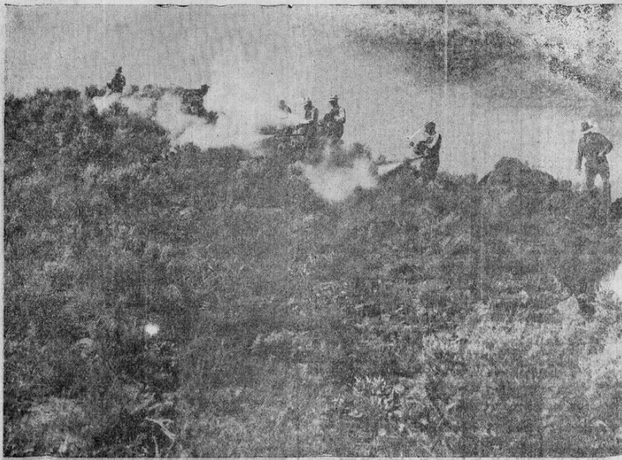
La guerra se ha apoderado de los campos de Utah, en los Estados Unidos, pero no es una guerra entre seres humanos sino una batalla a muerte con los grillos. Aquí vemos a agentes del gobierno combatiendo la terrible plaga que de tiempo en tiempo amenaza con destruir las cosechas del campesino estadounidense.