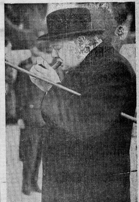
Tan bien vestido como siempre y con su eterno tabaco en la boca, Winston Churchill aparece aquí durante una reciente visita a un aeropuerto inglés para inspeccionar aviones de bombardeo llegados de Estados Unidos. (Foto Acme-Editors Press).