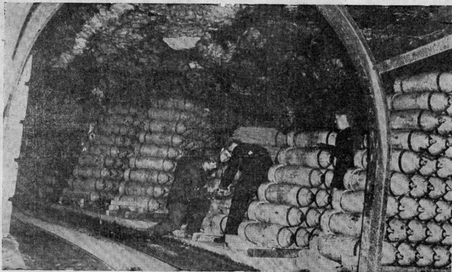
Rincón de un almacén subterráneo en Inglaterra, donde están depositadas muchas de las bombas que diariamente los aviones ingleses esparcen por diversas zonas alemanas.

Las becas se otorgarán a jóvenes graduados en facultades