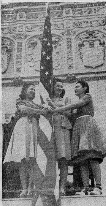
Commemorando el 43º aniversario de la ocupación de Puerto Rico por las tropas norteamericanas durante la guerra hispanoamericana, estas tres alumnas de la Universidad de Puerto Rico, en Río Piedras, unen sus manos alrededor de la bandera de las franjas y las estrellas..