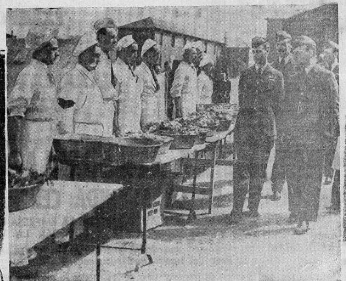
El rey Jorge de Inglaterra inspeccionó recientemente uno de los aeropuertos ingleses donde está instalada una escuela de aviación. Aquí le vemos al pasar frente a los cocineros, que se cuadraron ante él y su comitiva.

TOKIO, 27 UP. —Fuentes allegadas a la cancillería calificaron el envío de petróleo a Rusia de acto de alta traición hacia Japón, incompatible con el deseo de Churchill de que Esados Unidos deben reajustar las relaciones diplomáticas con Japón, agregando que tal acción representa un "paso más" en el camino de ayuda norteamericana a China, cosa que no sorprende al Japón. "Japón Times and Advertiser", después de señalar que los ocho puntos de la declaración Churchill-Roosevelt coinciden en muchas partes con los principios japonés, especialmente en que no tienen ambiciones territoriales y que desearían que todas las naciones tengan igual acceso a las fuentes de materias primas y mercaderías, exhortando a aprovechar esta ocasión para llegar a un arreglo, Joseph Grew confirió ocho veces en los últimos 14 días con el canciller Toyoda, durante una de esas conversaciones dos horas y media.