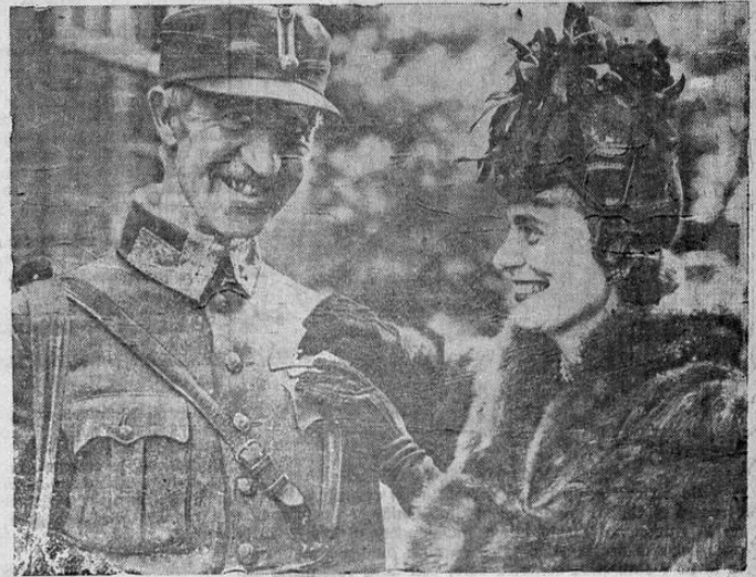
El general Schleicher, comandante en jefe de los ejércitos noruegos, que se encuentra en Inglaterra con parte de las tropas de su país que lograron escapar de las fuerzas de Hitler, fotografiado en los momentos en que era condecorado por la esposa del señor Antony Drexel Biddle, embajador de Estados Unidos en Noruega.