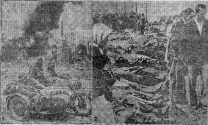
El "Panuco" envuelto en llamas mientras era extraído del muelle de Brooklyn para ser embarrancado en el banco de Red Hook. Varios remolcadores y barcos con bombas auxiliares en la labor.

El fuego comenzó a las 11 de la mañana y se extendió rápidamente por todo el muelle, una estructura de 800 pies de largo y 150 de ancho, pasando al "Panuco" que estaba atracado junto a él. Los barcos-bombas y los bomberos de tierra lucharon inútilmente por salvar algo del desastre. En el muelle había grandes bul-