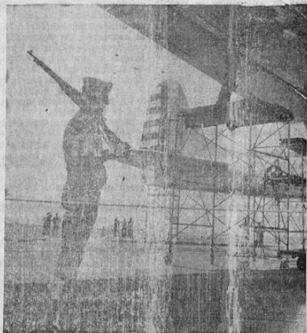
Centinela armado custodia el nuevo avión bombardero de los EE. UU. el Douglas B-19, para evitar cualquier sabotaje. El avión tiene su base actualmente en March Field, en California.