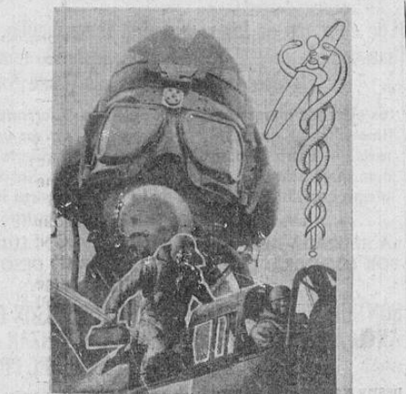
La medicina ha tomado su puesto en la aviación. La máscara de oxígeno es la panacea de los que navegan por el aire.

En esta fecha nacieron Luis Bonaparte, Rey de Holanda (1778) y Bourfet, el célebre novelista francés (1852).