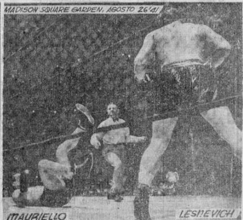
MADISON SQUARE GARDEN, AGOSTO 26/41 Un soberbio izquierdazo de Lesnevich envió a la lona a Mauriello en el segundo round. El encuentro, por el campeonato del mundo del peso semi-máximo, se celebró en el Garden el 26 de agosto. Lesnevich fué el triunfador oficial.

En lo que a Lesnevich respecta, su reinado no será largo. El hombre es de una mediocridad que da escalofríos y el compararlo con aquellos otros campeones de la categoría que se llama marcan Carpenter y Delaney, Benavente y Tommy Loughran, McTigue y Billy Conn, sería poco menos que un sacrilegio.