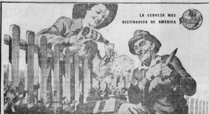
LA CERVEZA MAS DISTINGUIDA DE AMERICA