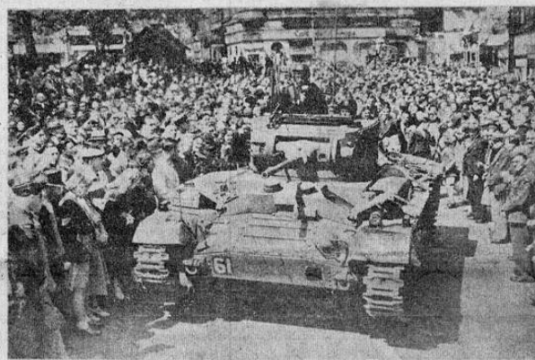
Una gran multitud estacionada en Leicester Square, de Londres, presencia el paso de los tanques de los últimos modelos, llamados "Valentine". Este y otros dos tanques llaman la atención de los ciudadanos londinenses, a su paso por las calles.

Para conseguir la exclusión, se han tenido que aportar pruebas fehacientes. Entendemos que algunas de estas gestiones van bien encaminadas y obtendrán buen éxito. Informaremos.