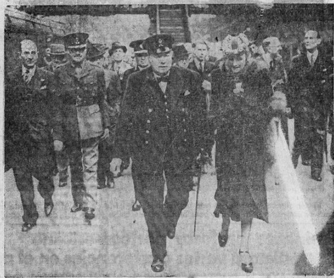
El primer ministro de Inglaterra, Winston Churchill, regresando a Londres después de su histórica entrevista con Roosevelt. Le acompaña su esposa.