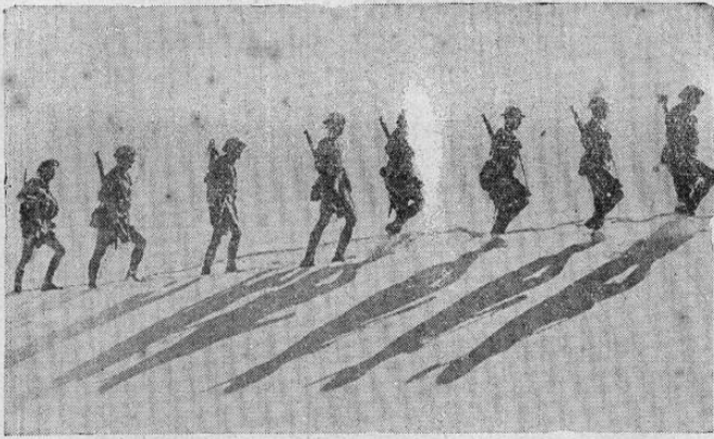
Bonita silueta formada por esta patrulla de infantería de Sur Africa, durante operaciones de reconocimiento en una base británica en cierto lugar del desierto occidental