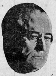
Presidente Roosevelt cuyo discurso de esta noche man tiene en la mayor expectación.

WASHINGTON, 11. UP. — En fuentes generalmente bien informadas se dice que entre los puntos que abordará en su sensacional discurso de esta noche el Presidente Roosevelt, se hallan el de la necesidad de armar con equipo adecuado de guerra, a todo buque mercante, a fin de lograr de esta manera una mayor protección a la marina; el aumento del sistema de convoyes y la protección a los buques que transportan materiales de guerra a las naciones que luchan contra las potencias del eje. También se cree que en su discurso Roosevelt se referirá al resultado de las entrevistas sostenidas por su representante personal, Myron Taylor, con su Santidad el Papa Pio XII. Los esfuerzos del gobierno para acrecentar todo impulso de producción destinada a la