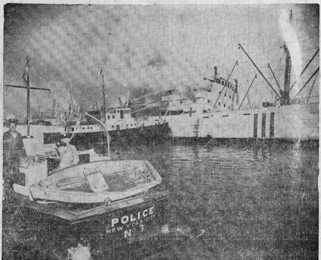
En el puerto de Nueva York fué incendiado recientemente un buque fines anclado allí. Un tripulante resultó muerto. La escena muestra una lancha de la policía y un barco bomba actuando en las operaciones de salvamento.

El director del registro público propondrá el proyecto a la secretaría de gobernación