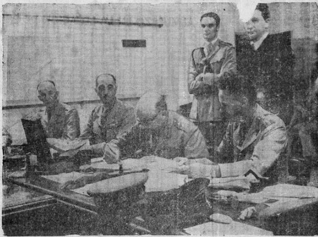
El general Sir Henry Wilson, firmó a nombre de la Gran Bretaña el acuerdo de armisticio con Siria, después de una campaña de 30 días. A la derecha del general Wilson está el general Catroux, de las Fuerzas Francesas Libres, que ocuparán ese territorio hasta que termine la guerra.