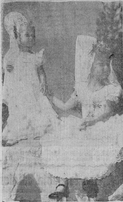
Estas dos pequeñas figuritas participaron en la reciente Fiesta Española celebrada en California para conmemorar la fundación de la población de Santa Bárbara por los colonizadores españoles.

DIARIO ILUSTRADO DE LA TARDE Director: José M a Pinand Redacción, 3240