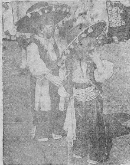
Además de los trajes típicos españoles, en la Fiesta Española de Santa Bárbara, en California, se vieron también los trajes propios de México, país fronterizo y cuyos ciudadanos se han mezclado por años con los españoles y norteamericanos de la zona del Pacífico.

progreso común que los circunspicados de nuevo y le señalan un camino lleno de futuro, de combates, derrotas, pero que las premiones mutuas y de reeducación geográficas han rangü brimientos espirituales sin cuento.