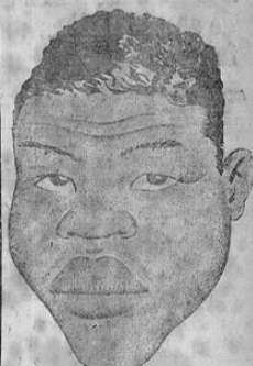
JOE LOUIS, VENCEDOR DE LA PELEA DE ANOCHE

Tan pronto sonó la campana del primer round, los adversarios iniciaron un rápido cambio de gol-