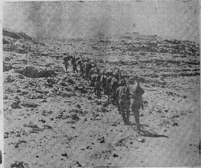
Destacamento de tropas australianas atraviesa el desierto para relevar a los soldados ingleses que han resistido heroicamente a los alemanes en Tobruk. Las tropas proceden del litoral, después de haber hecho un desembarco.