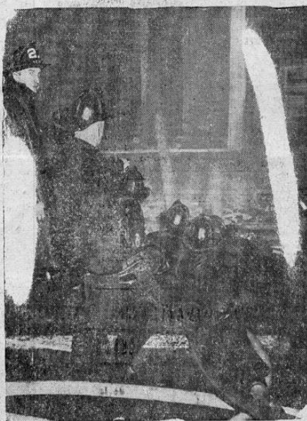
Tirados en el suelo estos bomberos neoyorquinos cobrieron un enorme incendio que comenzó en el sótano de una farmacia. Treinta y seis bomberos resultaron afectados por los llamas.