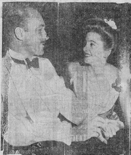
Joan Fontaine y Brian Aherne aprovecharon unas cortas vacaciones en Nueva York para asistir al estreno de una obra teatral en Broadway.