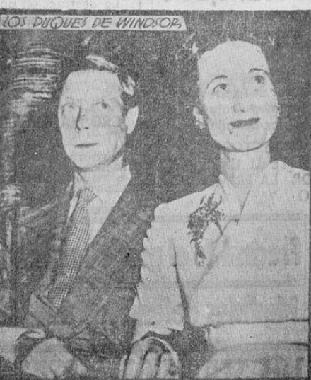
Una de las últimas fotografías de los duques de Windsor, cuya visita a Washington ha causado gran decepción a la sociedad al saber que no podrá festejar a la famosa pareja de acuerdo con sus merecimientos. El hombre que renunció al imperio más grande de la tierra "por la mujer que amaba", aparece en la foto acariciando la mano de su feliz consorte.

Ya hemos hablado de la decepción sufrida por las figuras cuyos nombres aparecen anotados en el "Registro Social". Baste decir que no ha sido menor, tal vez, la de otras figuras de la vida americana, Senadores, diputados, jueces de la Corte Suprema, así como funcionarios de los diversos departamentos del gobierno no tendrán acceso tampoco a las breves e informales ceremonias que se celebrarán en Washington con motivo de la visita de la famosa pareja.