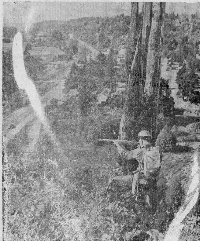
Soldados del ejército norteamericano en maniobras como franco tirador en los campos del estado de Washington, en la zona oeste de los Estados Unidos.