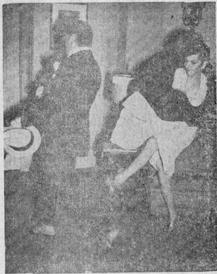
Puede que la cámara sea "más rápida que la vista" pero el pie no es el más rápido que el lente de la cámara que recogió este momento, cuando Lupe Vélez, la vivorachista mexicana de la pantalla, le propinaba un puntapié al hombre del "Gran Perfil", es decir, al famoso John Barrymore, en una escena de una película en que ambos desempeñaban importante papeles.