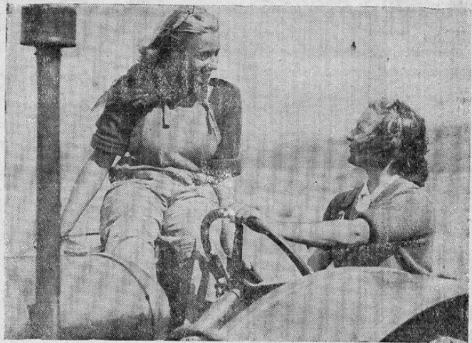
Exoficinistas y empleadas inglesas han cambiado su vida en las grandes ciudades por las labores en el campo, donde sustituyen a los hombres que han ido a luchar en los campos de batalla. La fotografía muestra a un par de voluntarias descansando para conversar.

funcionario del Ministerio de Relaciones Exteriores declaró que versó sobre temas de carácter general, particularmente sobre el conflicto de Ecuador con Perú. Añadió que el doctor Viteri Lafronte permanecerá en esta capital hasta el jueves, con el objeto de proseguir sus conversaciones, siendo esto inesperado por cuanto el diplomático ecuatoriano tenía fijado partir con destino a Buenos Aires mañana por la mañana.