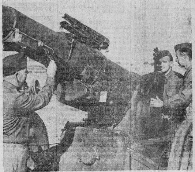
El teniente coronel Manly Gibson, del ejército norteamericano (a la izquierda) muestra la colocación del rifle que él ha sugerido para ser usado en las maniobras del cuerpo de artillería y así ahorrarle mucho dinero a los que pagan contribuciones al Estado, ya que de ese modo no se usarían los proyectiles de gran calibre.

RESPUESTA a... (Viene de la página 1)... Alajuela el señor Presidente de la República, la inauguración del hermoso edificio construido por la actual administración para el patronato nacional de la infancia de aquella ciudad. Est mañana recogimos la noticia de que la inauguración del edificio ha sido pospuesta. Por más esfuerzos que se realizaron no fue posible concluir el edificio totalmente. La inauguración será fijada para una fecha próxima, que se pondrá en conocimiento del público oportunamente.