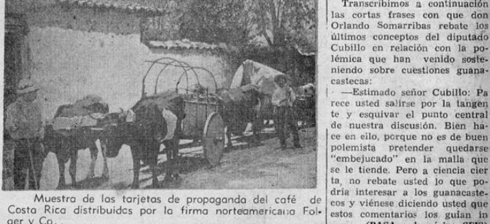
Muestra de las tarjetas de propaganda del café de Costa Rica distribuidas por la firma norteamericana Folger y Co.

A MELITOPOL ENTRARON LOS ALEMANES LONDRES, 10. UP. — La radio de Vichy anunció: "Según informaciones procedentes de Berlín los alemanes entraron en Melitopol". La ciudad de Melitopol se encuentra en la región noreste de la península de Crimea.