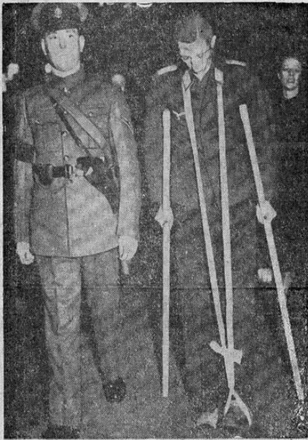
Oficial de aviación alemana, derribado por la Real Fuerza Aérea, en los momentos en que salía de un tren en Londres, escoltado por un oficial de las fuerzas territoriales inglesas.