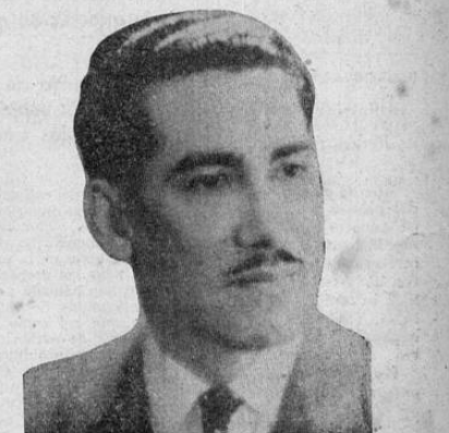
EX-PRESIDENTE ARIAS MADRID