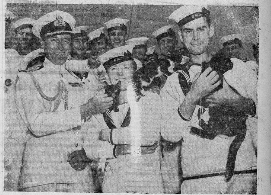
El capitán Lord Louis Mountbatten, primo del rey Jorge, (a la izquierda), acariciando a las mascotas Minnie, Butch y Tranto (de izquierda a derecha) a bordo del "Illustrious", después de haber asumido el mando del portaviones inglés en Portsmouth, Virginia, U.S.A. donde había permanecido algún tiempo en reparaciones. "Toronto" recibió ese nombre por haber nacido cuando el buque atacaba a Toronto, en Italia.