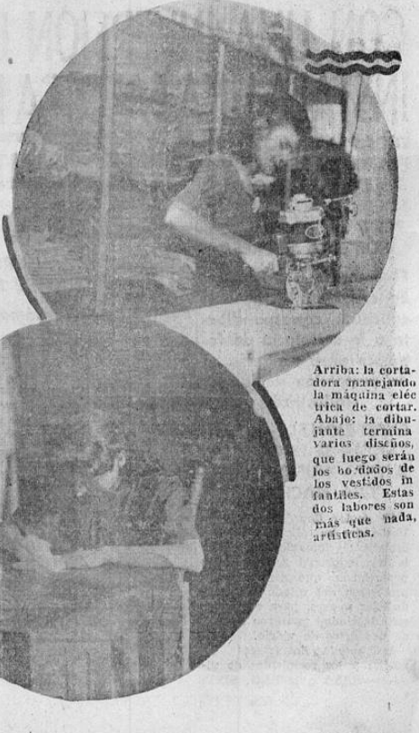
Arriba: la cortadora manejando la máquina eléctrica de cortar. Abajo: la dibujante termina varios diseños, que luego serán los bordados de los vestidos infantiles. Estas dos labores son más que nada, artísticas.