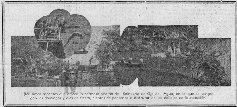
Bellísimos aspectos que ofrece la hermosa piscina del Balneario de Ojo de Agua, en la que se congregan los domingos y días de fiesta, cientos de personas a disfrutar de las delicias de la natación

BELLISIMO LUGAR DE perfectamente acondicionado AL CUIDADO DEL FERROCARRIL ELECTRICO AL P