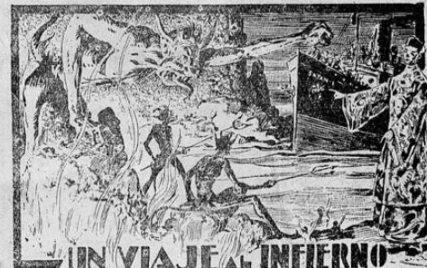
UN VIAJE AL INFIERNO

Ya están puestas las localidades a la venta: Lunetas, Butacas y Palco $ 5.00—Palco de Galería $ 2.00—Galería $ 1.00