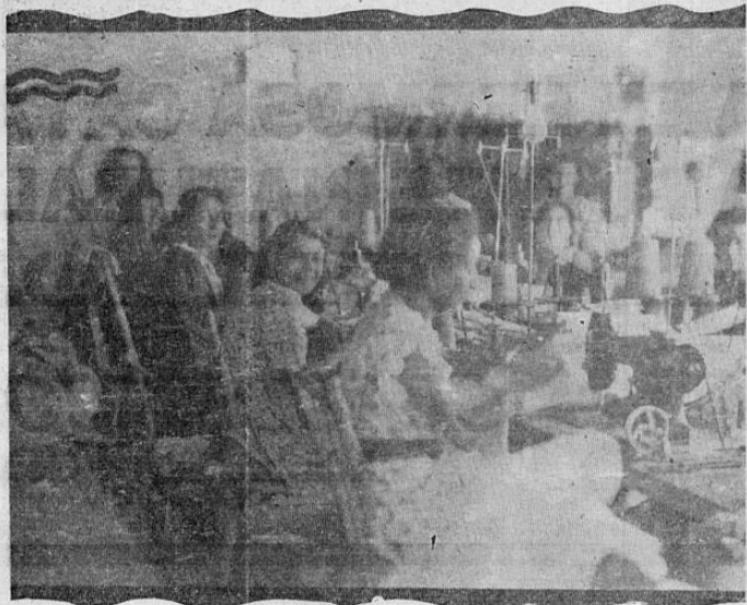
UN ASPECTO DEL TALLER Y PARTE DE SU PERSONAL