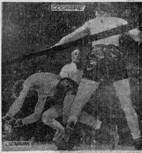
Uno de los viajes a la lona del campeón mundial del peso ligero Lew Jenkins, quien en su encuentro con Red Cochrane, flamante campeón de la categoría imbestia, produjo una exhibición detestable que fue un golpe para el boxeo neoyorquino.

Jenkins tiene que defender ahora su título contra Sammy Angott, en un encuentro que ha sido aplazado para diciembre. La Comisión neoyorquina lo ha obligado a que deposite una fianza de 1.500 dólares que asegure que se entrenará apropiadamente. Ese entrenamiento tendrá que realizarse en el estado de Nueva York, bajo la supervisión del mencionado organismo oficial.