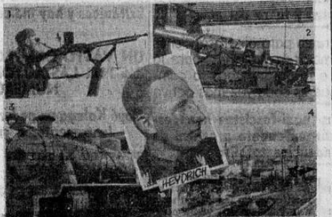
Reinhardt Heydrich, "protector" nazi de Bohemia y Moravia cuyas medidas crueles no logran quebrantar la resistencia pasiva de los checos y (1) la gran ametralladora "Bren" que ahora se construye en Inglaterra; (2) un cañón de sitio de la fábrica "Skoda"; (3) una locomotora salida de la misma fábrica checa y (4) la planta principal "Skoda" de Pilsen donde los actos de sabotaje llegaron a ser de tal naturaleza que los nazistas estimaron conveniente imponer sus medidas de terror.

(El autor de este artículo es un refugiado checo que recientemente fijó su residencia en los Estados Unidos. Ha tenido oportunidad de observar personalmente la cooperación que los checos exiliados prestan al esfuerzo bélico aliado. Por razones obvias utiliza un pseudónimo.)