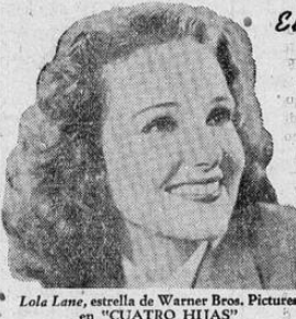
Lola Lane, estrella de Warner Bros. Pictures en "CUATRO HIJAS"

es la maravilla que millones de personas admiran día tras día, porque imparte a sus dientes una blanquedad deslumbrante. Hasta hoy nunca se había obtenido tal brillantez con una pasta que fuera completamente inofensiva... al usar Pepsodent conteniendo Irium no existe peligro... no hay temor ninguno de dañar el precioso esmalte de los dientes.