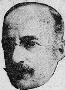
EXCMO. SR. LIC. DON ALBERTO ECHANDI, MINISTRO DE RELACIONES EXTERIORES