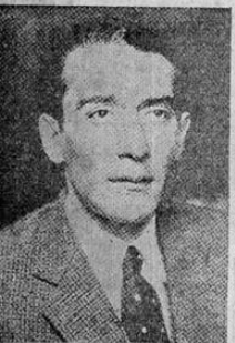
LOMBARDO TOLEDANO, denunció hoy la existencia en México de un gran movimiento fuertemente estructurado, de nazismo

quien se afirma que no abandonará a Moscú, y conducirá, desde luego, la defensa de la metrópoli soviética.