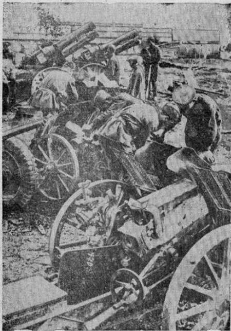
Cañones alemanes siendo inspeccionados por artilleros soviéticos después de haber caído en sus manos al vencer los rusos en una batalla en los alrededores de la aldea "N", según comunicado ruso.

Desde hace varios días el nuevo comandante en jefe de los ejércitos centrales dirige las operaciones frente a Moscú y logrado mantener a raya los desesperados ataques nazis