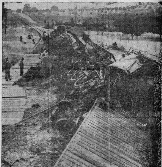
He aquí como quedaron la locomotora del ferrocarril del Western Pacific y el tren de pasajeros "Exposition Flyer", al chocar recientemente cerca de California, E. U. A. Tres personas resultaron muertas y once heridas.