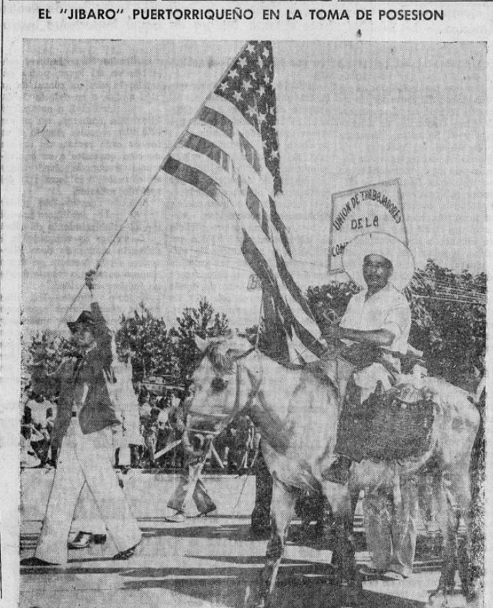
Miles de "jibaros" puertorriqueños (hombre del campo), como este que aparece en la fotografía, asistieron en San Juan a la toma de posesión del nuevo Gobernador señor Rexford Guy Tugwell.