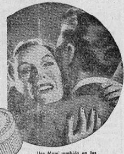
... Use Mum también en los hallos higiénicos, por pulcritud

No arriesgue fracasar en amor por descuidar protegerse contra los efectos del sudor axilar. Use Mum, que prolonga su pulcritud todo el día. Bastan 30 segundos para aplicarse Mum y puede hacerlo ya vestida o recién rasuradas las axilas porque Mum es inofensiva y refrescante. No detiene la transpiración normal. Simplemente evita su desagradable olor. ¡Proteja sus atractivos! Compre Mum hoy.