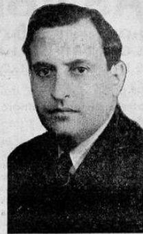
Excmo. Sr. Dr. don RAFAEL ANGEL CALDERON GUARDIA, Presidente de la República