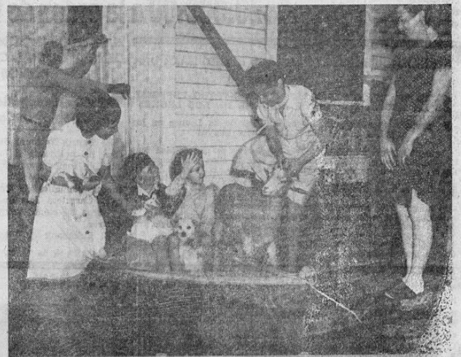
Esta familia no olvidó a sus animales preferidos cuando se vió obligada recientemente a abandonar su hogar en la Louisiana, Estados Unidos de América, al aproximarse uno de los ciclones que po resta época asolan generalmente esa área.