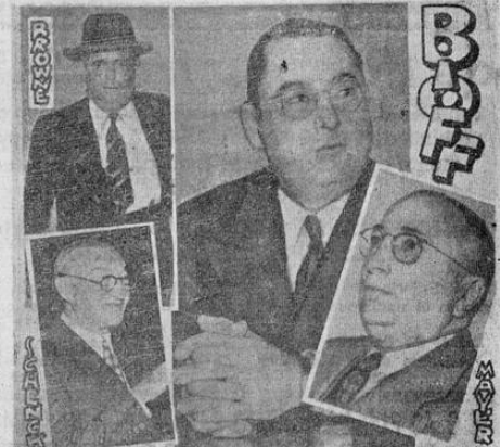
En esta composición fotográfica aparecen, arriba: los líderes del obrerismo norteamericano George Browne y William Bioff a los que se sigue proceso por haber obligado a distintas compañías cinematográficas a pagarles más de medio millón de dólares bajo amenaza de declarar huelgas en sus estudios. Abajo: Nicholas M. Schenck y Louis M. Mayer, dos de los magnates de Hollywood perjudicados.

La reacción desfavorable causada por las revelaciones en cuanto a los antecedentes y actividades de Browne y Bioff, ha motivado que en la reciente convención anual de la Federación, celebrada en Seattle, Washington, se tomarán medidas para destituir al primero. El procedimiento utilizado para ello, sin embargo, ha causado tantas críticas como el hecho mis-