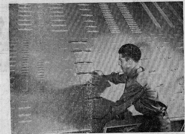
He aquí en miniatura lo que será la armada de dos océanos que está organizando Estados Unidos. Esta exhibición fue presentada en la Feria de Los Angeles, California, recientemente celebrada.