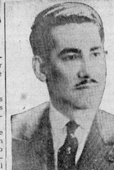
Dr. ARNULFO ARIAS

Informes recogidos ayer indican que en las horas de la mañana de ayer fueron recibidas por la referida Junta las primeras cartas conteniendo los atestados requeridos para realizar esas revalidaciones. En ningún año la tarea de revalidación será mayor que en este, ya que es crecidísimo el número de pensiones de gracia que fueron dictadas por el congreso y sancionadas por el ejecutivo este año.