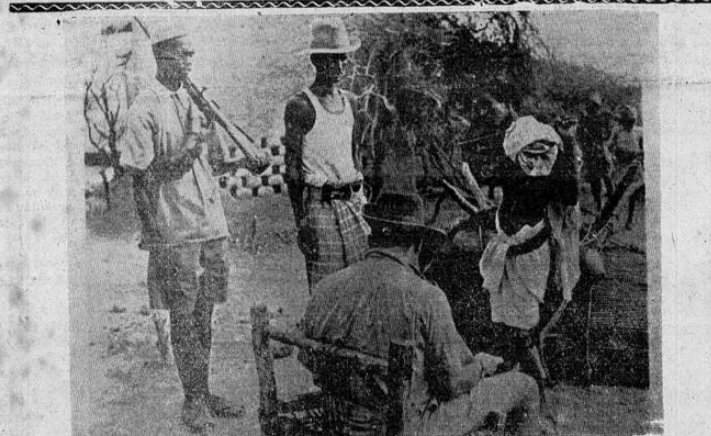
TOTAL BLOQUEO A DJIBOUTI. — Un soldado nativo de las reales fuerzas africanas inglesas ha detenido a un camellero que sale de la Somalia Francesa, totalmente bloqueada y un oficial de las fuerzas africanas que aparece en la foto, mientras que por mar los barcos vigilan constantemente.