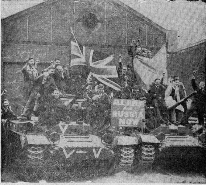
Trabajadores de una fábrica de tanques en Inglaterra saludan a la manera antifascista en ocasión de la entrega de un número de tanques al embajador ruso, Moisky, para su embarque a Rusia.