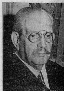
El Dr. José Luis Cantillo, presidente de la Cámara de Diputados de la Argentina...