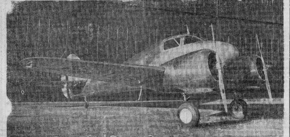
Este es el nuevo tipo de avión propio para entrenar pilotos. Es fabricado por la Curtiss, en los Estados Unidos, y tiene dos motores de 280 caballos de fuerza pudiendo desarrollar una velocidad de 200 millas por hora, con un radio de acción de 750 millas.