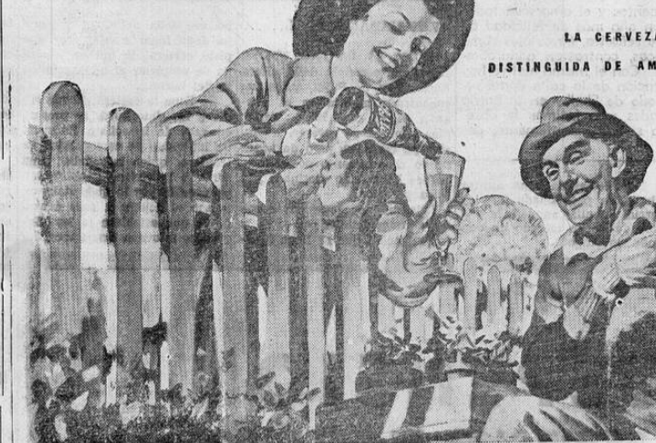
LA CERVEZA MAS DISTINGUIDA DE AMERICA

Vas a consagrarte sacerdote; van tus manos y tu aliento a consagrar la Santa Hostia y el vino, sangre de Cristo. Vas a ver el milagro de tu poder. Oh! noble levita. Dichoso tú, que puedes levantar tus manos; ora en el momento de la consagración misma, ora para bendecir a todos, por ser ésta precisamente, la misión tuya. Sagrada misión por cierto: puesto que su alcance está en seguir a Cristo. Por esto el hecho de bendecir es grande, y es porque se necesita poder para hacerlo; es decir estar capacitado, con la gracia del sacerdote, quien es el que tiene los poderes recibidos del cielo; y lo hace pensando en que todos somos hermanos, como si su corazón, abrazara a la humanidad. Por eso la voz del sacerdote nos atrae, por ser medio para que el hombre se eleve y magnifique. Como está en tí el sacerdote, bendice también aquel que te curará males, porque ya sabes que el hombre de bondad cuando es rico en esta virtud, o sea males, si es fatal así mismo. Bendice a todos, para que tu sacerdocio nos eleve; y nos elevará por tu fe y por tu virtud; ya que en tí está ha sido gran-