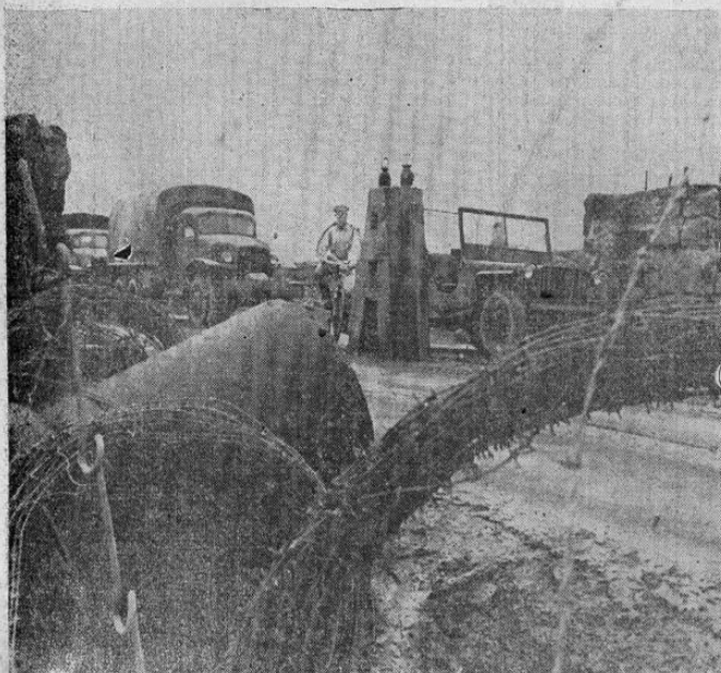
Islandia, en un tiempo pacífica isla, se está acostumbrando poco a poco a escenas como ésta. En las carreteras se encuentran emplazados obstáculos como el que aparece en la foto, para el caso en que el enemigo decida llevar a cabo un ataque por sorpresa.

En la Escuela Normal está funcionando una, sobre cuyo modelo se copiarán los restantes organismos