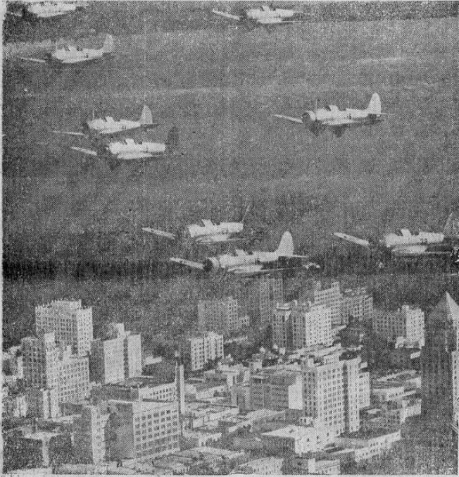
Bombarderos en picada fotografiados sobre la ciudad de Miami durante recientes maniobras aéreas de la aviación norteamericana.

En la tarde de hoy se efectúa esta entrevista, para ver la fórmula de arreglar el incidente planteado entre la United y la Northern Railway