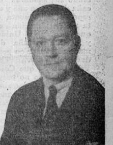
Mr. ARTHUR BLISS LANE,