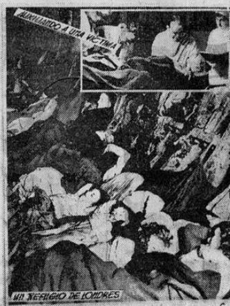
Inglaterra ha estado estudiando lo que parece haber resuelto el peligro de epidemias motivadas por el hacinamiento de seres humanos en los refugios contra los ataques aéreos. La escena se refiere a uno de esos refugios en Londres. En el ángulo, la ciencia prestando sus auxilios a una víctima de la feroz contienda entre las naciones.

El Tío Samuel está decidido a desastiar, especialmente a las enfermedades que se producen a consecuencia de la guerra. Y está resuelto a prestar la debida atención a la exigencia natural de un país saludable que demanda que en ningún caso sus habitantes estén desnutridos.