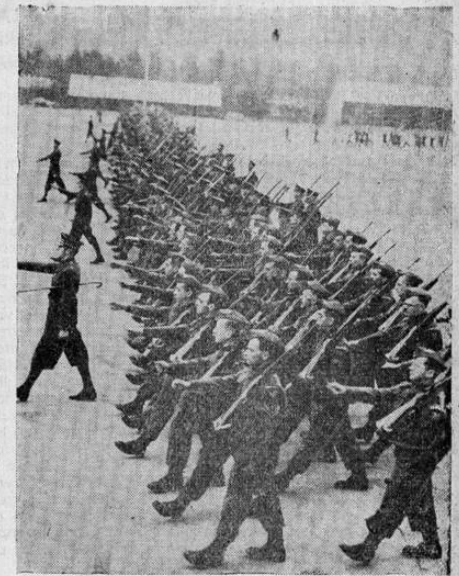
Este es el famoso destacamento de la Primera Guardia Nacional Americana, compuesta por ciudadanos americanos residentes en Inglaterra.