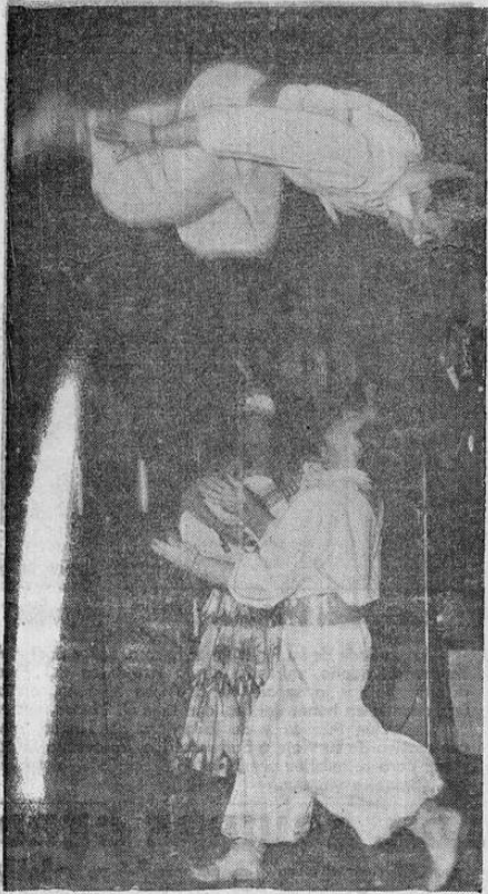
La foto capta un momento emocionante del número de variedades de los Hermanos Williams, famoso grupo de bailarines acrobáticos argentinos, que actualmente triunfan en Nueva York en uno de los principales hoteles de la metrópoli.

LOS HERMANOS WILLIAM TRIUNFAN EN NUEVA YORK