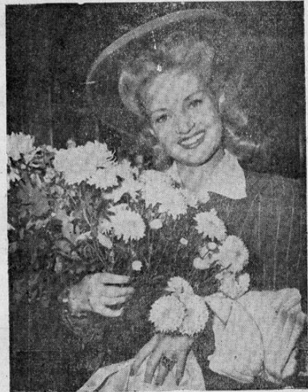
Betty Grable, la actriz cinematográfica, fotografiada en Nueva York, a su llegada para asistir a la "premiere" de la película "Un Yanqui en la Real Fuerza Aérea Británica", donde desempeña un papel principal.