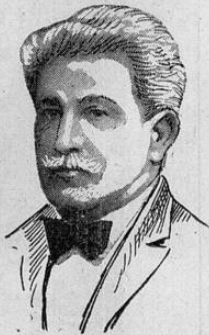
Dr. Rafael Calderón Muñoz, por el Partido Republicano Nacional