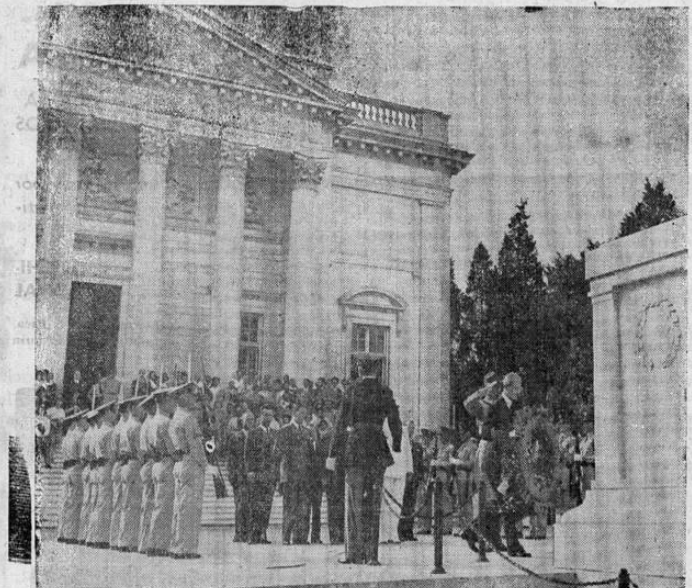
El ex-Presidente de Venezuela, General Eleazar López Contreras, fotografiado en los momentos en que colocaba una ofrenda floral en el Monumento al Soldado Desconocido de Estados Unidos, en el Cementerio de Arlington, en Virginia.