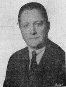
Excmo Sr. Mr. Arthur Bliss Lane, Ministro Americano

Por la vía aérea el catorce del mes siguiente sigue para su patria, el Excmo. Señor Mr. Arthur Bliss Lane, Ministro de los Estados Unidos de Norte América en Costa Rica, quien permanecerá varios meses en aquella gran nación. LA RAZON le adelanta al estimable diplomático su atento saludo de despedida.