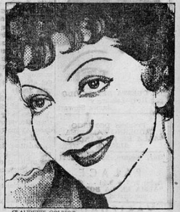
CLAUDETTE COLBERT Paranaoua

LAS ESTRELLAS DE LA PANTALLA saben la importancia que tiene el que su cutis sea absolutamente sin mancha. Esto explica el por qué no menos de 847 estrellas del cine tienen puesta su confianza en el Jabón Lux de Tocador. Su maravillosa espuma tan cremosa penetra profundamente dentro de los poros, haciendo desaparecer suavemente todas las partículas de suciedad. Conserva la piel tersa y hermosa.