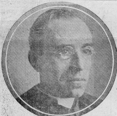
PIO XII, quien dirigió un mensaje al mundo

VIOLENTAS ACCIONES SE LIBRAN EN LUZON MANILA 24 UP. — Se anuncia oficialmente que los japoneses continúan desembarcando refuerzos en la isla de Luzon haciendo frente a un intenso fuego. Los combates más violentos se libran en los frentes del norte y del sur.