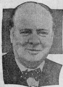
CHURCHILL, cuyas declaraciones damos a conocer hoy