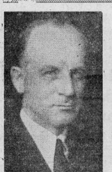
SUMNER WELLES, quien llevará la representación americana a Río de Janeiro.