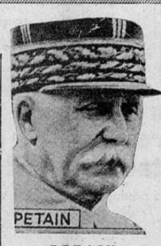
PETAÏN, quien no ha dimitido y sigue al frente del gobierno de Vichy