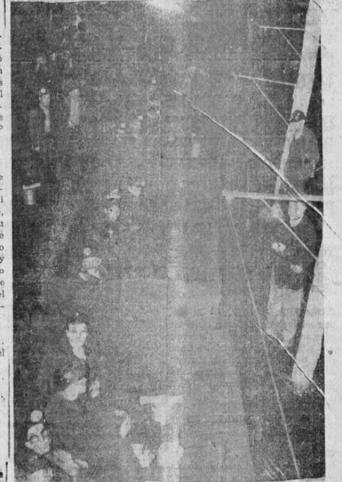
Estos mineros regresan a las minas "cáutivas" de carbón, después que John L. Lewis aceptó el plan del presidente Roosevelt...

cha muy intensa; "el anuncio de las once a. m. grabado en la noche que japoneses efectuaron algunos bombardeos..."