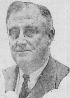
ROOSEVELT, dirigirá hoy un mensaje a todos los pueblos libres de la tierra

En número considerable los denunciantes pedirán al Banco los medios económicos para establecer en forma las explotaciones mineras