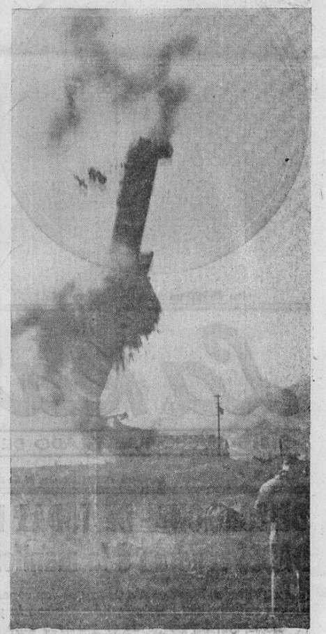
Esta era la chimenea de ladrillo más alta existente en los Estados Unidos—310 pies—y fué fotografiada en los momentos en que era demolida. Fué construida en 1916.