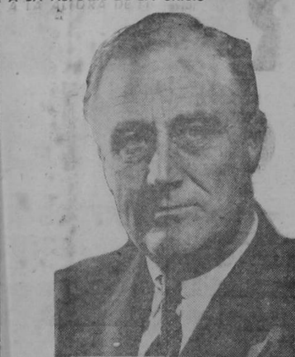
Uno de los últimos retratos del presidente Roosevelt.

rar en Alemania. Matando a la mejor Alemania, a la de sus grandes pensadores, a la de sus políticos generosos, a la de sus artistas y sabios, a la de sus poetas y escritores, el nazismo es una amenaza contra la libertad humana y es contra eso, y no contra los alemanes, contra quien es preciso tomar medidas, dolerosas ellas, pero que las circunstancias imponen ya que se trata de una lucha en la cual va jugándose nuestra vida de nación, su libertad y sus instituciones.