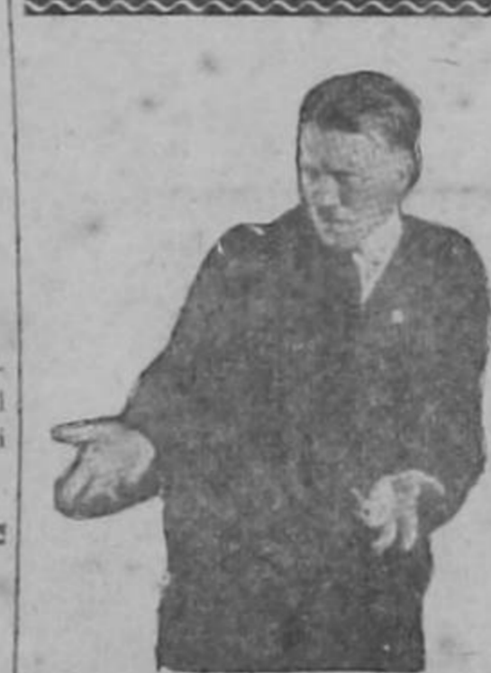
HITLER, cuya remoción de Fuehrer parece vislumbrarse en vista de los desastres nazis en los frentes de guerra