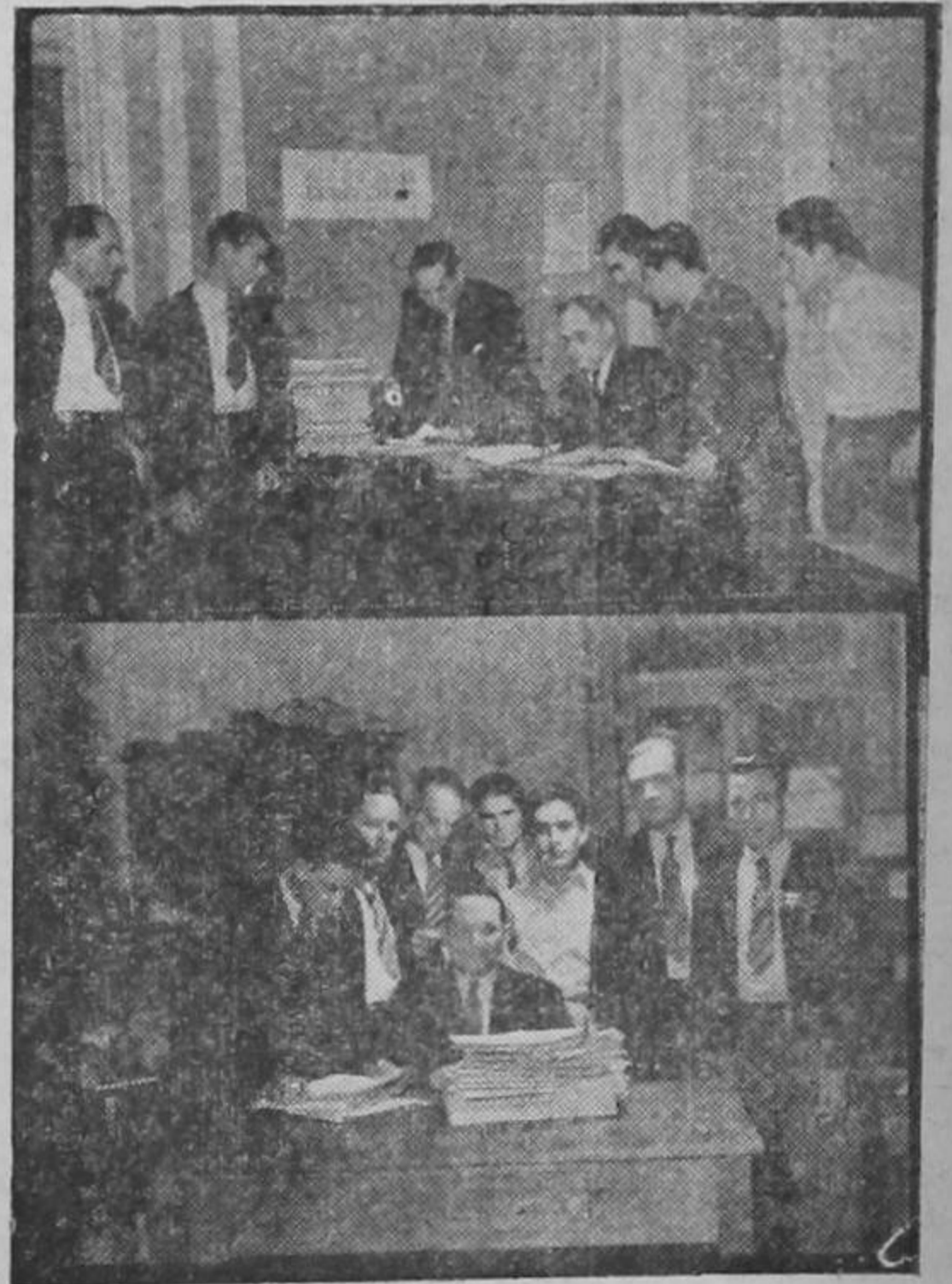
La inscripción de las papeletas de Diputados y Municipales

La cámara de LA RAZON obtuvo ayer en la Secretaría de Gobernación estas dos fotos, que muestran la labor de la inscripción de papeletas de municipales y diputados, cerrada y terminada a las doce de la noche. Se suscitaron varios hechos sensacionales, de los cuales informamos a nuestros lectores en esta misma edición.