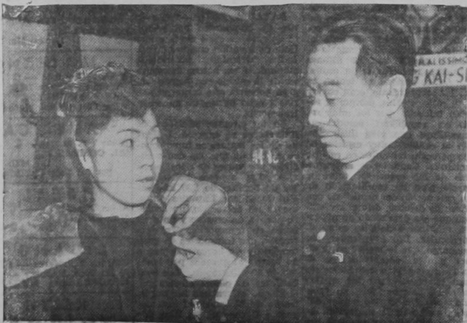
Los chinos están usando ahora en los Estados Unidos botones especiales para identificarse de los japoneses y evitar represalias injustificadas.