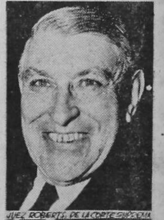
JUEZ ROBERTS, DE LA CORTE SUPREMA

Nosotros también tenemos que sacar a la luz los factores que sorprendernos ante tí, tierra cuyos desastros son tan grandes como las montañas, cuyas faltas parecen servirte tan bien ya que eres tan tonta como sabia; tenemos que sorprendernos ante tí, patria amada, necia, angelical e incomparable, la más peligrosa y la más generosa de todas las adversarias que jamás esgrimiera una espada contra otras naciones. Hombres y poetas tendrán mucho que decir de tí, no importa cual sea tu destino, en los días lejanos del porvenir, y enfiarnos que respiramos el aire peligroso cuando el viejo león acorralado levantó una vez más su majestuosa cabeza para mirar en derredor y contemplar a sus enemigos".