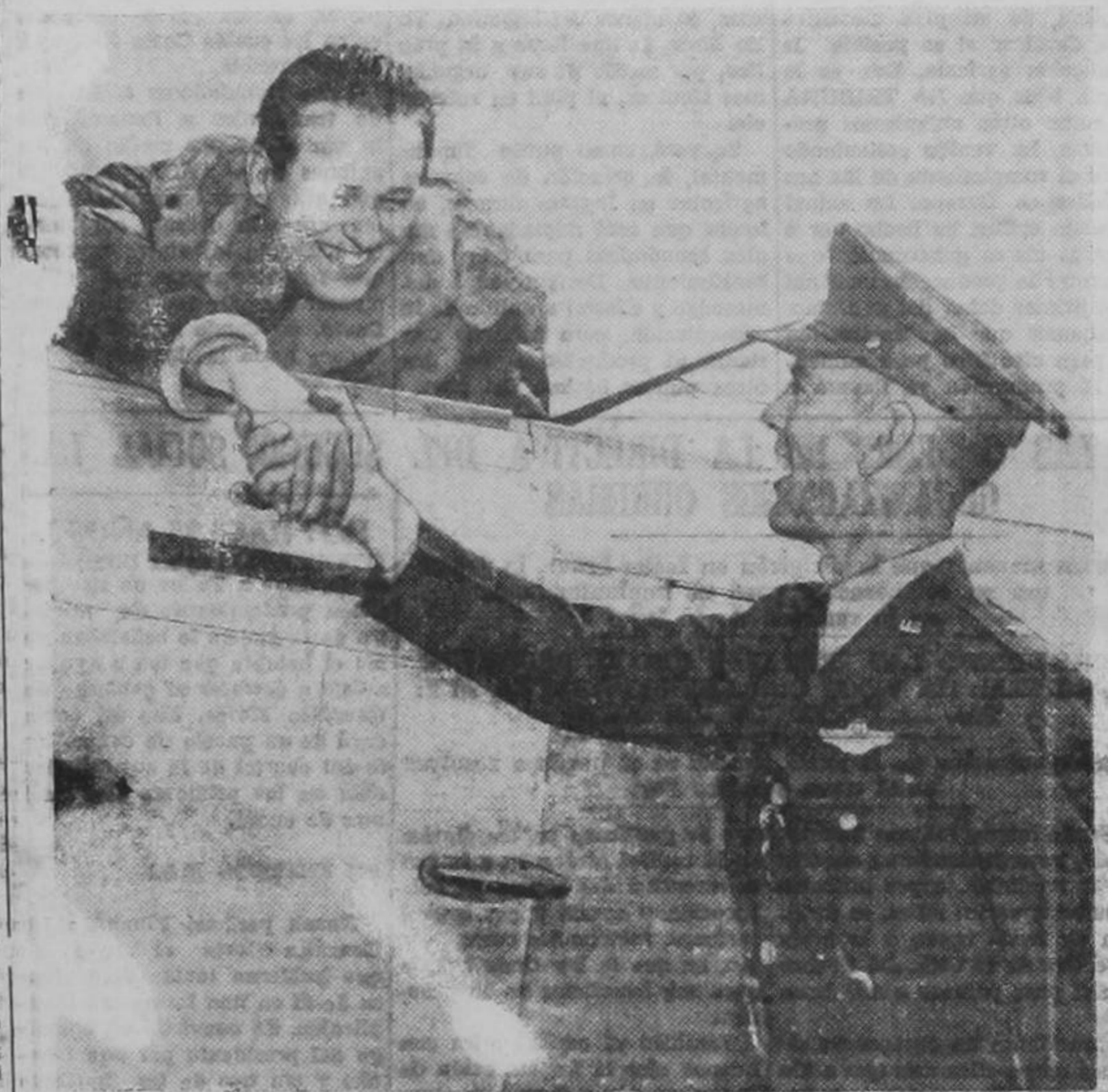
El capitán Elliott Roosevelt (a la izquierda), felicitado por el general de brigada Hubert R. Harmon, al despegar de Randolph Field, en Tejas, para iniciar un vuelo de reconocimiento.