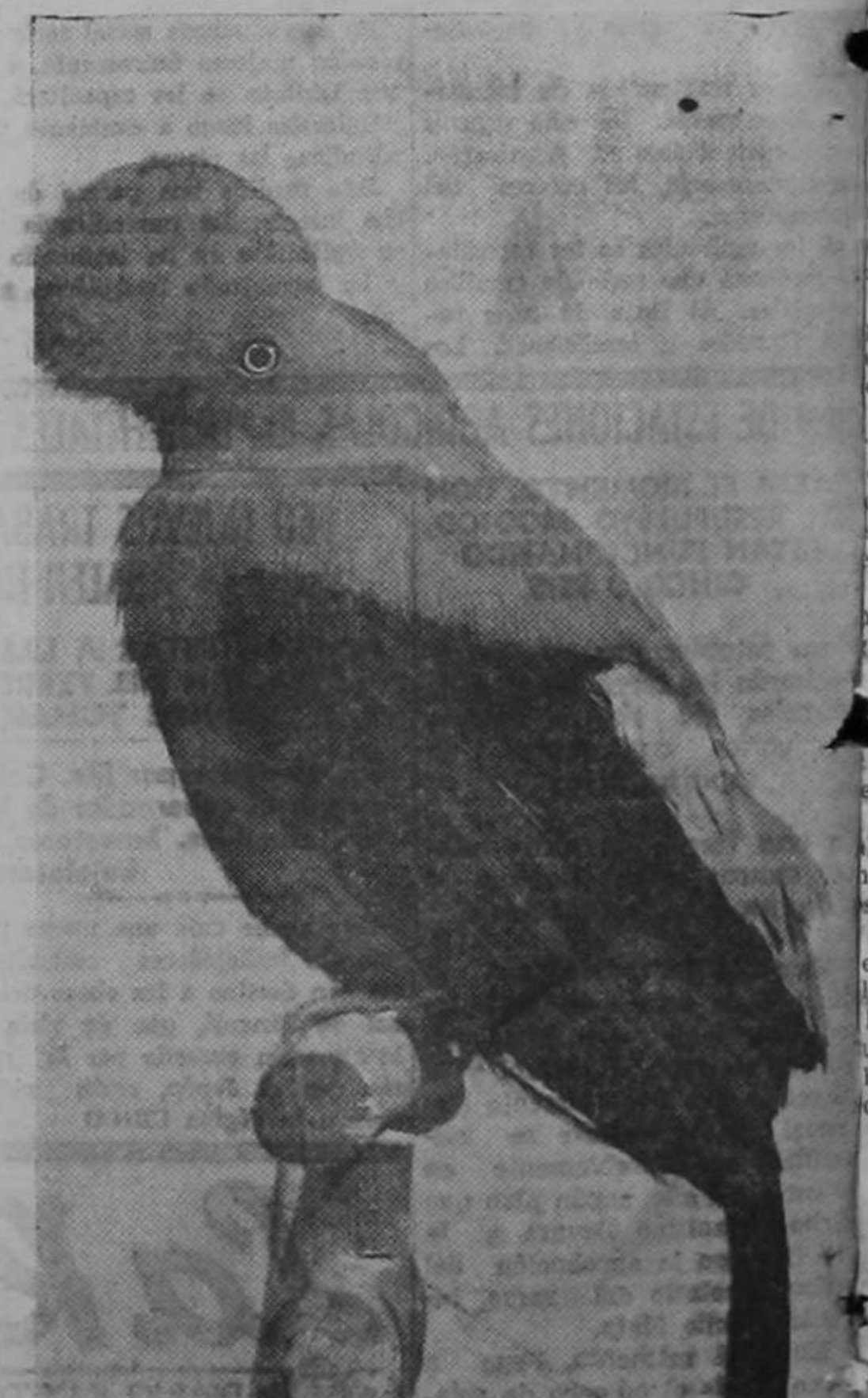
Este lindo papagayo de los Andes colombianos fue fotografiado a poco de ser ingresado en una colección de aves del Jardín zoológico de Nueva York.

Los radioescuchas de Costa Rica podrán oír esta transmisión especial sintonizando los circuitos acostumbrados de la estación de Londres en 25 y 31 metros.