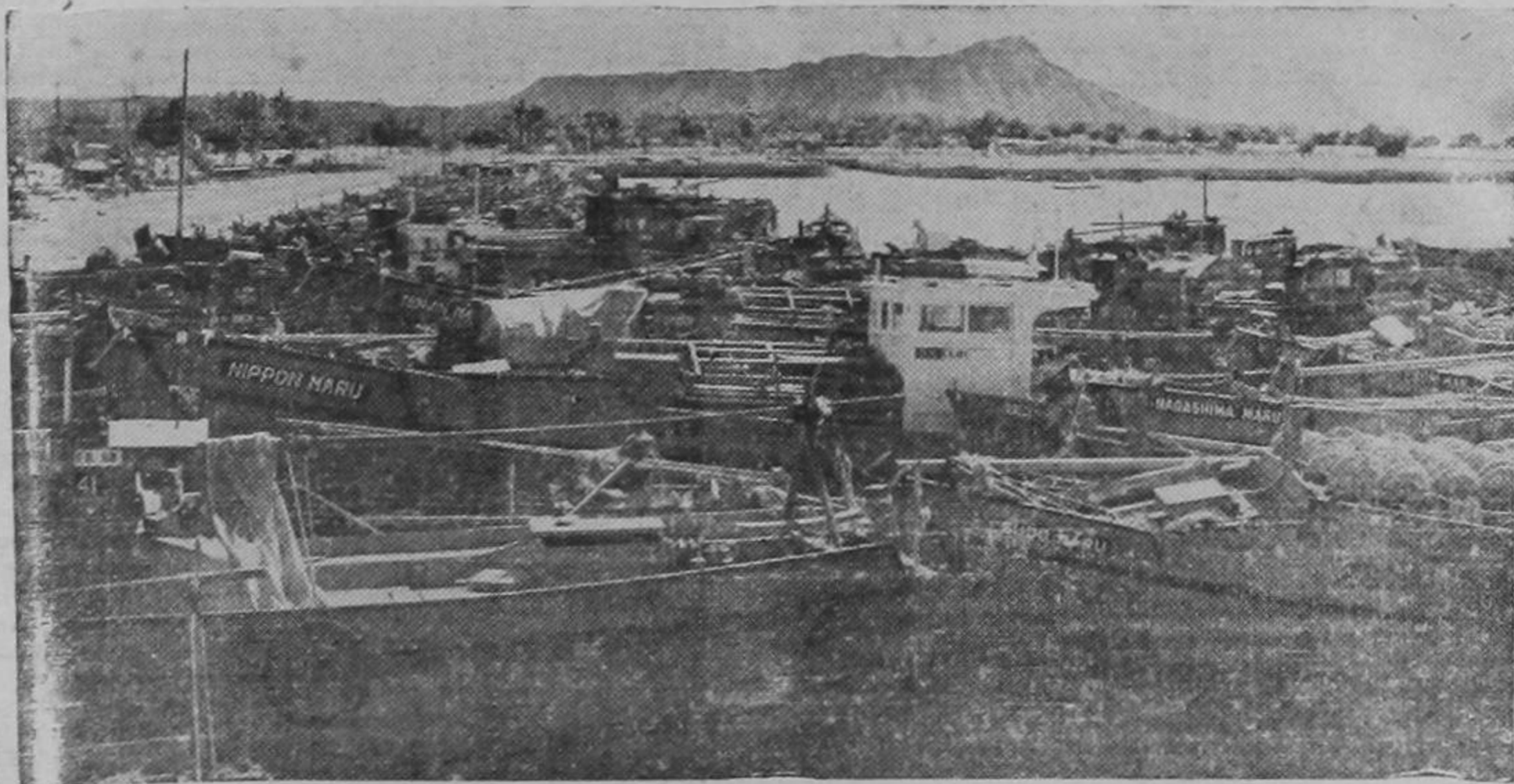
En un puerto del Canadá fué tomada esta gráfica. Aparecen varios barcos del Japón, capturados por los Estados Unidos. — Obsérvese que la cantidad es bastante