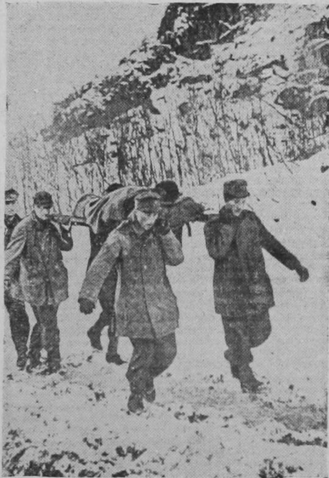
Véase como se retiran los nazis en Rusia, ante el empuje arrollador del Ejército Rojo. A cuestas con los heridos. Derrotados, hambrientos y desilusionados. Pero qué Napoleón.