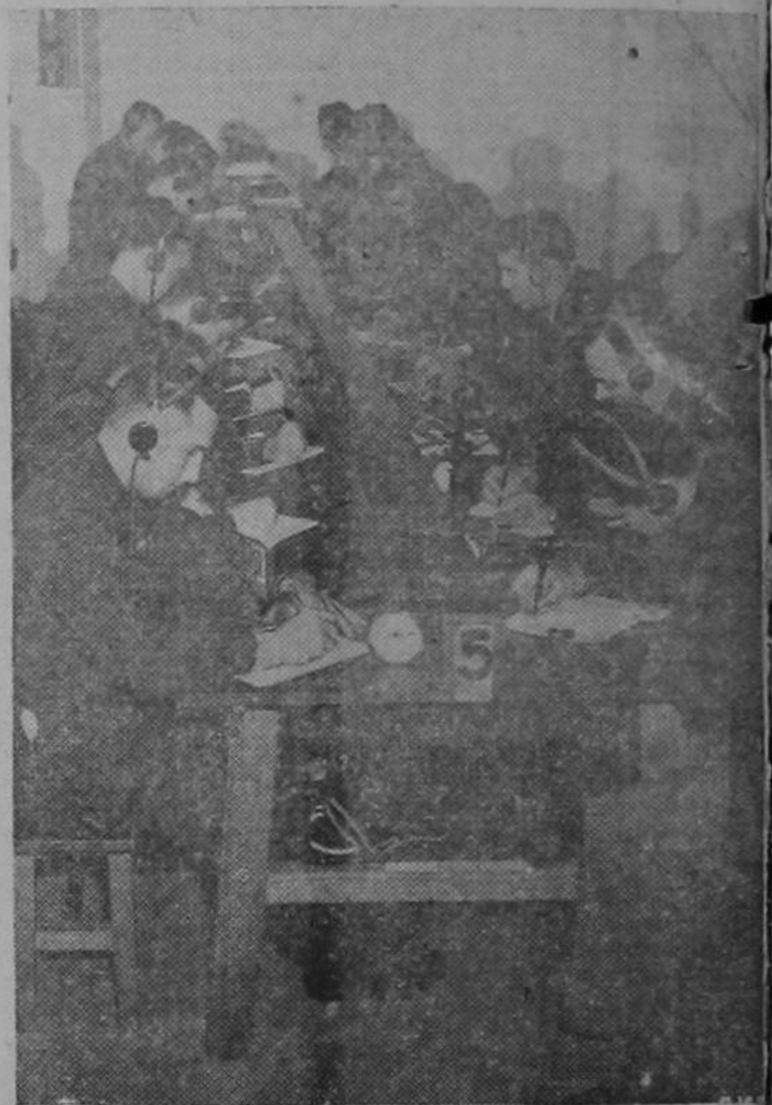
Radio-operadores de Estados Unidos trabajando arduamente. Son los oídos de la América. Están en sintonía con todo el mundo, especialmente con Oriente, Moscú y Londres.