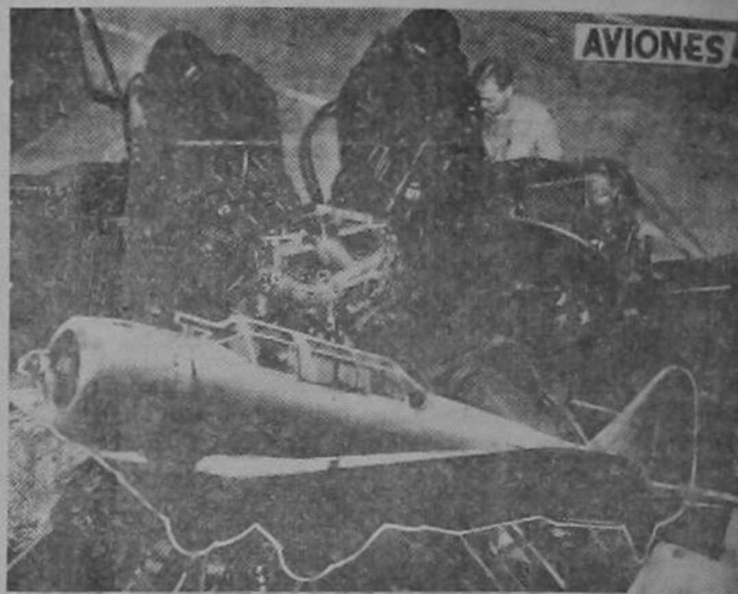
De esta nueva fábrica de la Wright Aeronautical Corporation de Cincinnati, saldrán al mes más de mil motores Cyclone 14. En ella laboran los héroes de la retaguardia.

Las decisiones adoptadas en Washington la semana pasada significan que puede movilizarse ahora a toda la industria automovilística. (1) Es desesperarse que se aplique inmediatamente la misma medida a todas las otras grandes industrias mecánicas que ha nesta