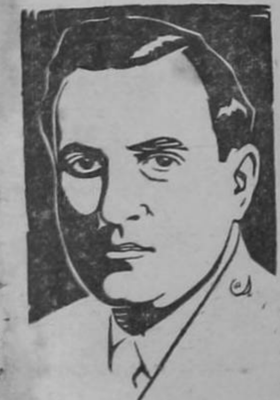
Dr. CALDERON GUARDIA