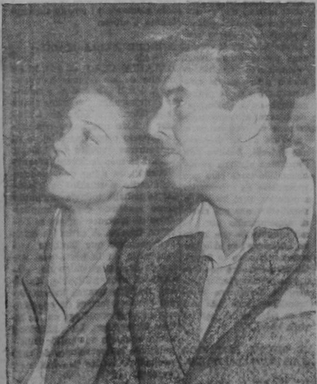
George Brent y Ann Sheridan, que han contraído nupcias, aparecen muy juntos, fotografiados en su luna de miel. Nosotros envidiamos a Brent sinceramente.