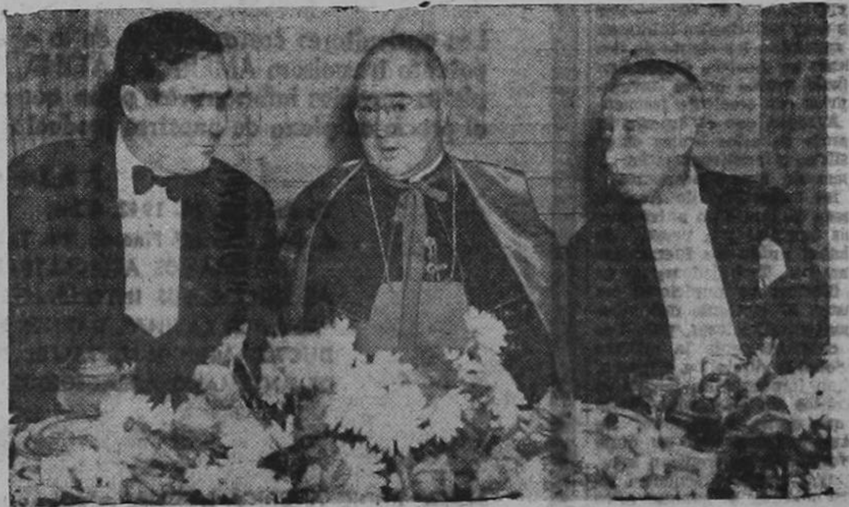
Wendell Willkie, a la izquierda, posa para el fotógrafo junto al arzobispo de Nueva York, Monsenor Spellman, y Al Smith, ex-gobernador de la metrópoli, después de haberse dirigido a los camensales en una comida organizada para levantar fondos para el Hospital de San Vicente.