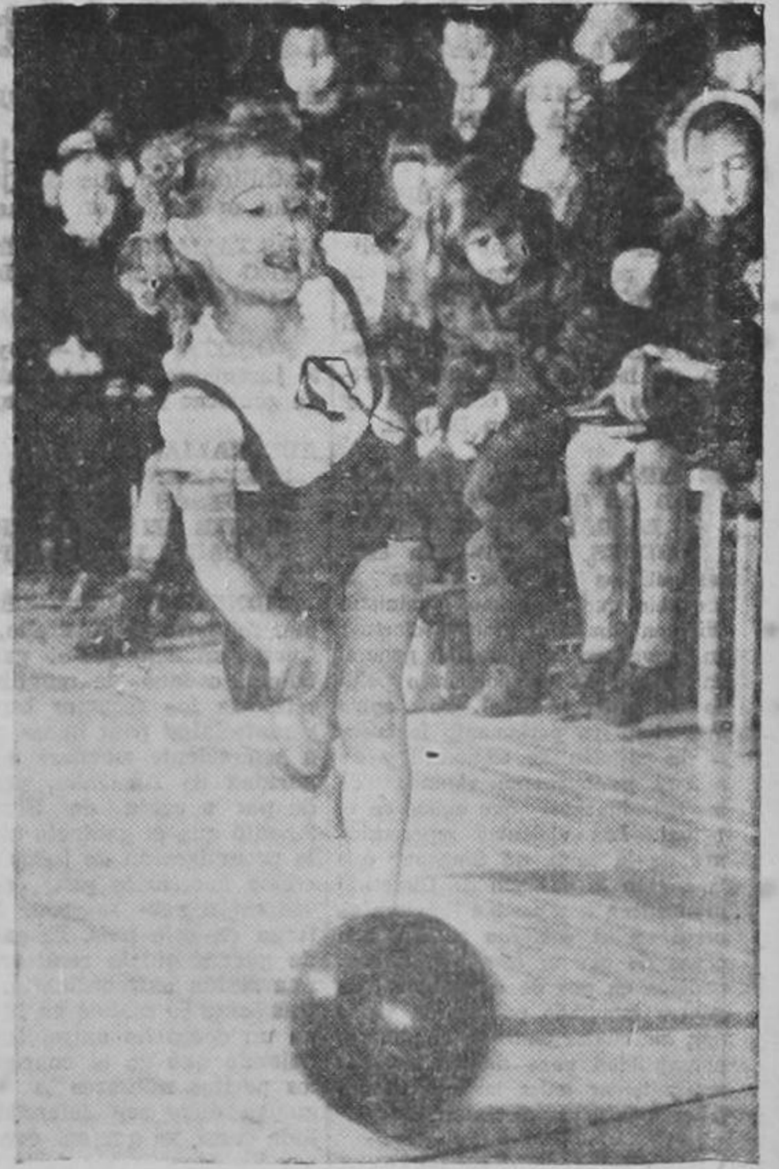
La democracia exige, además de gente honrada, gente sana y fuerte. Véase cómo desde la más temprana edad, son necesarios los juegos y los deportes. Esta niña está entusiasmando al público de Norte América con sus demostraciones legítimas de fútbol.

resolverse la situación política nacional, y se defina cuáles son las candidaturas presidenciales que habrán de quedar en la arena. Así lo indican los esfuerzos que llevan a cabo partidarios de las distintas tendencias.