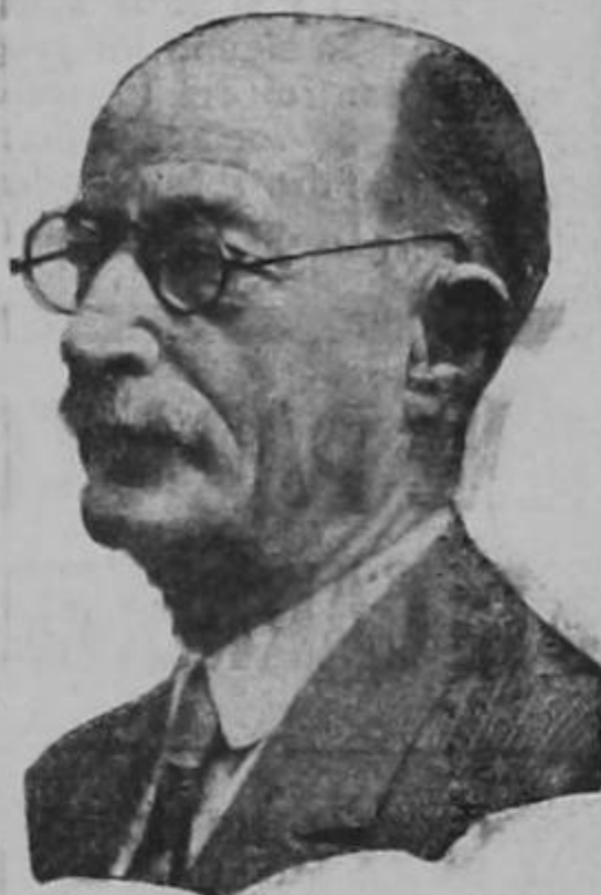
Excmo. Sr. Lic. don Alberto Echandi Montero, Secretario de Relaciones Exteriores.

Hoy festeja su cumpleaños, el honorable Excmo. Sr. Lic. don Alberto Echandi, Ministro de Relaciones Exteriores y altamente apreciado en todas las esferas oficiales, diplomáticas y sociales costarricenses. LA RAZON le envía su afectuosa enhorabuena.