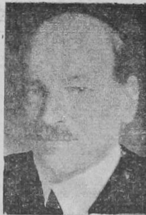
CLEMENT R. ATLEE