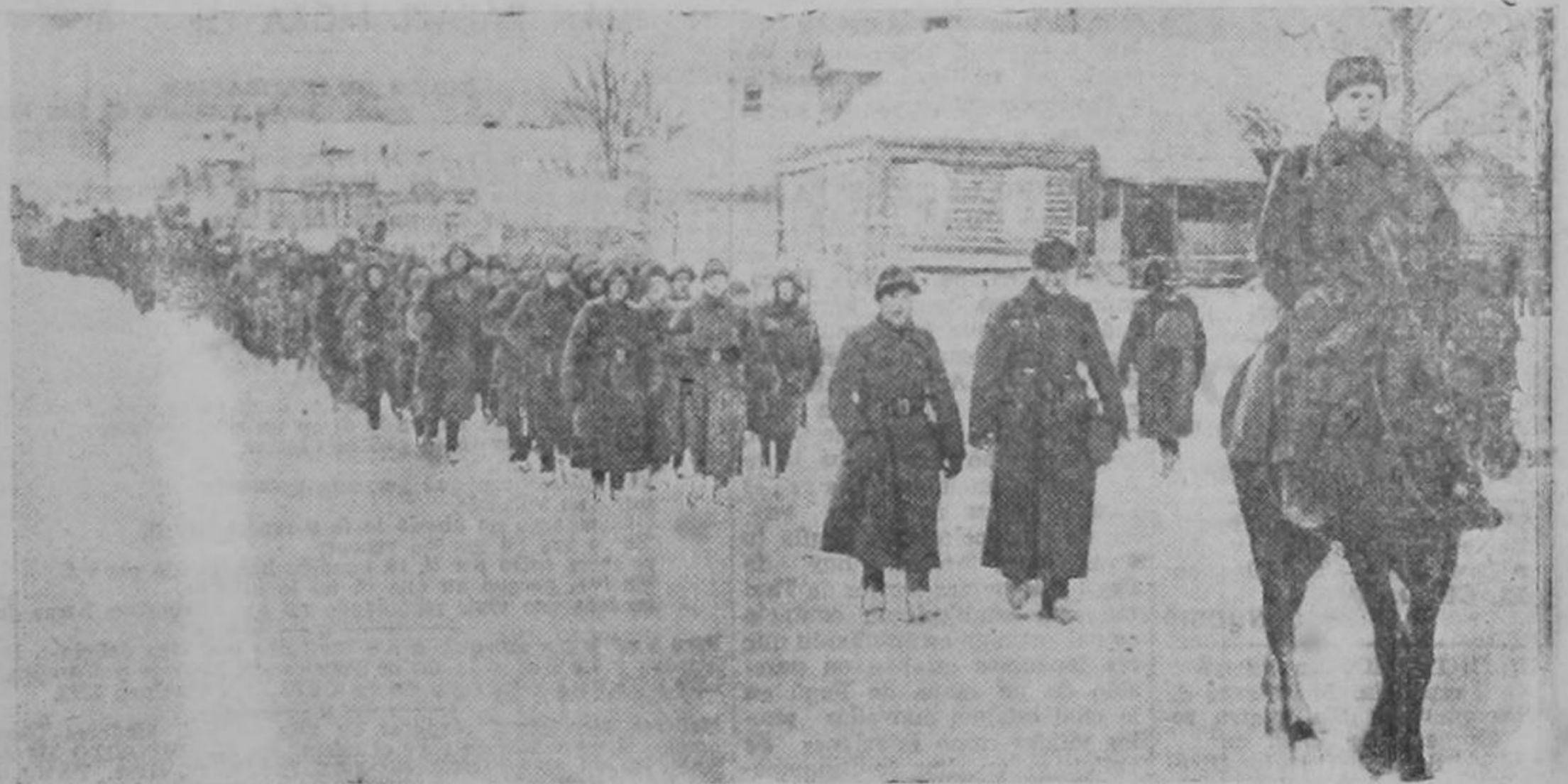
Estos son soldados de uno de los regimientos rusos que están a la ofensiva en el frente oriental europeo, reconquistando posiciones que hasta ahora habían ocupado los alemanes.

GRATIS DESDE HOY GRATIS EN SU PROPIA CASA APRENDA INGLES