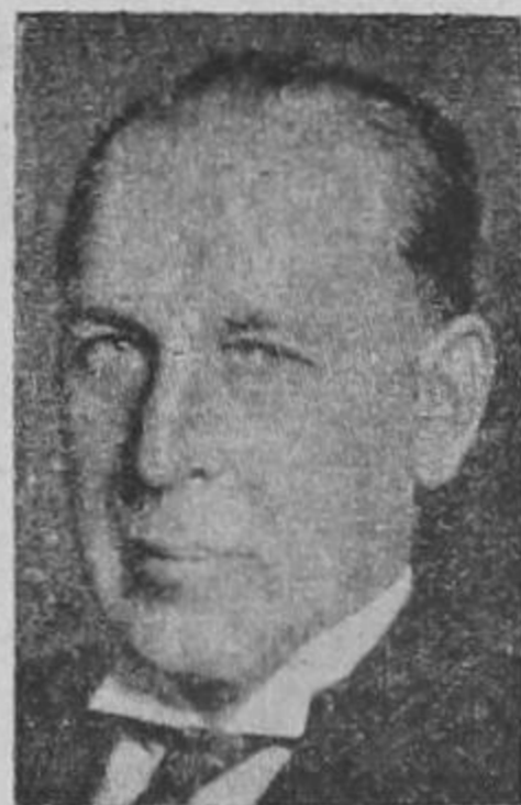
SIR JOHN ANDERSON