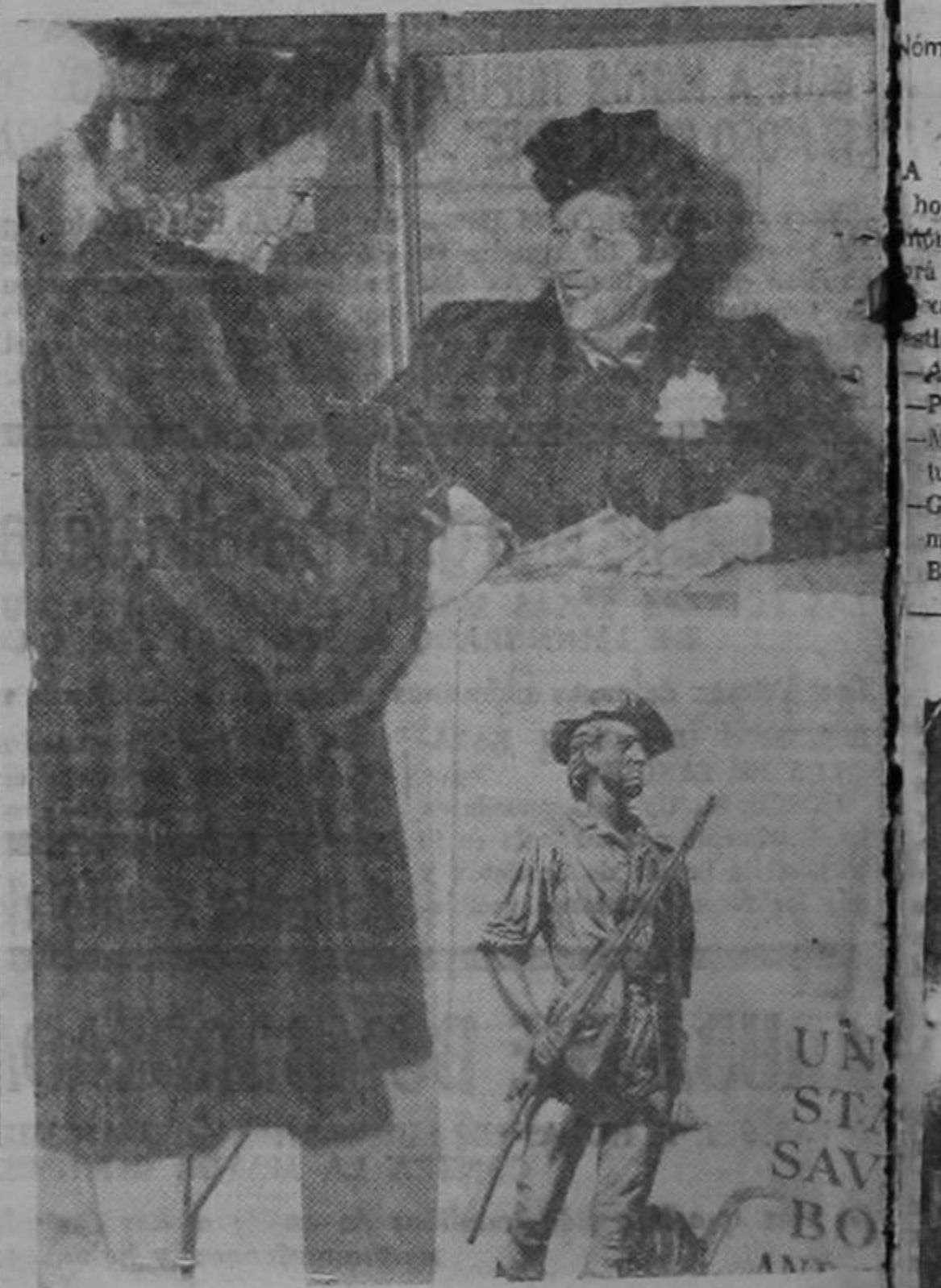
Sonja Henie, la popular estrellas del cinema y campeona el arte de patinar sobre el hielo, compra sellos de la defensa nacional en uno de los numerosos quiscos que a efecto se encuentran instalados en diversas zonas de Nueva York.