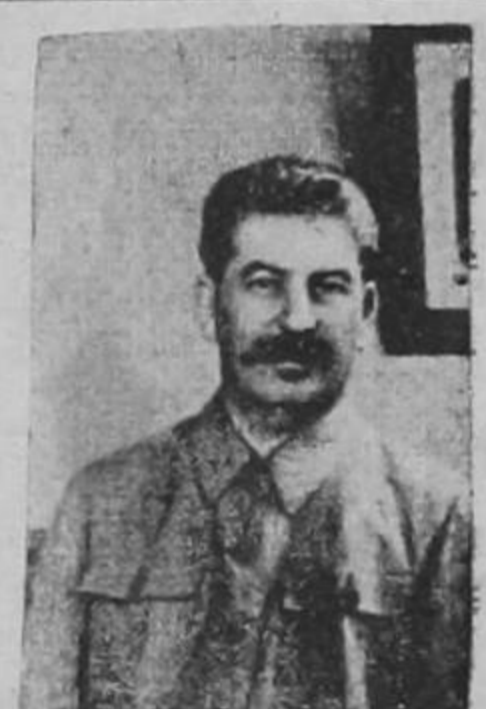
STALIN quien pronunció la Orden del Día al ejército ruso, con motivo del XXIV aniversario de su creación.