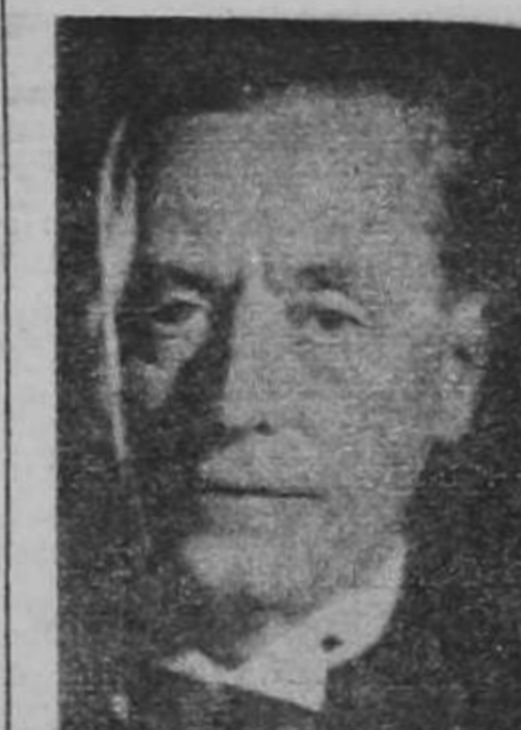
ARTHUR GREENWOOD uno de los Ministros que separó anoche Churchill de su Gabinete, en la tercera "purga" que en término de un mes hace del gabinete británico.