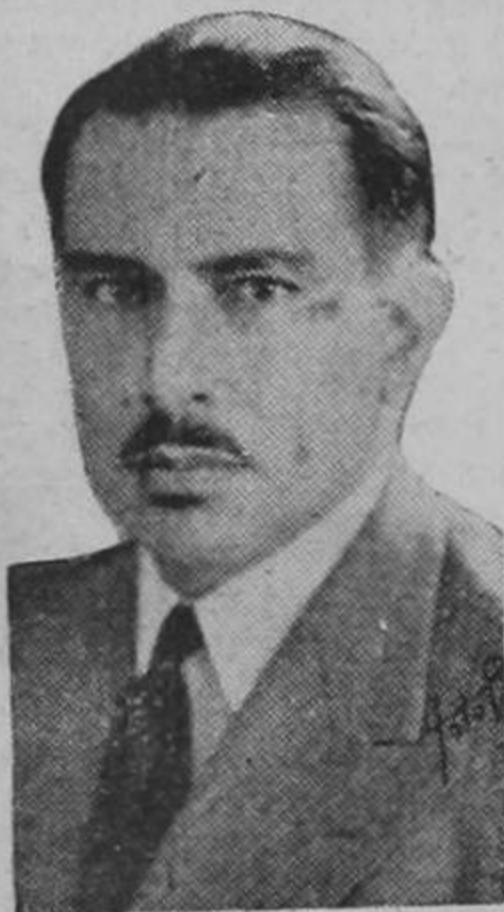
Don TEODORO PICADO