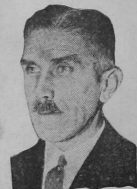
VON PAPEN, quien estuvo a punto de perecer ayer en Angora