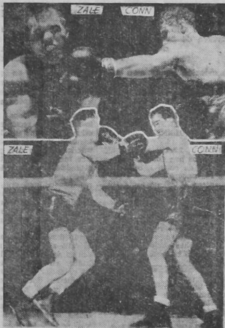
Arriba, una izquierda de Conn hace blanco en la cara de Zale y éste se contrae de dolor. Debajo, el campeón de peso mediano se tambalea después de recibir una andanada de golpes de Billy Conn, pero éste no puede aprovechar la oportunidad para terminar el encuentro por la vía rápida.

tante el intenso calor tropical. Por lo demás, expresa ese despacho, los soldados nipones están sufriendo por la falta de agua, pues los numerosos pozos de las aldeas están infestados y no se puede beber de su agua.