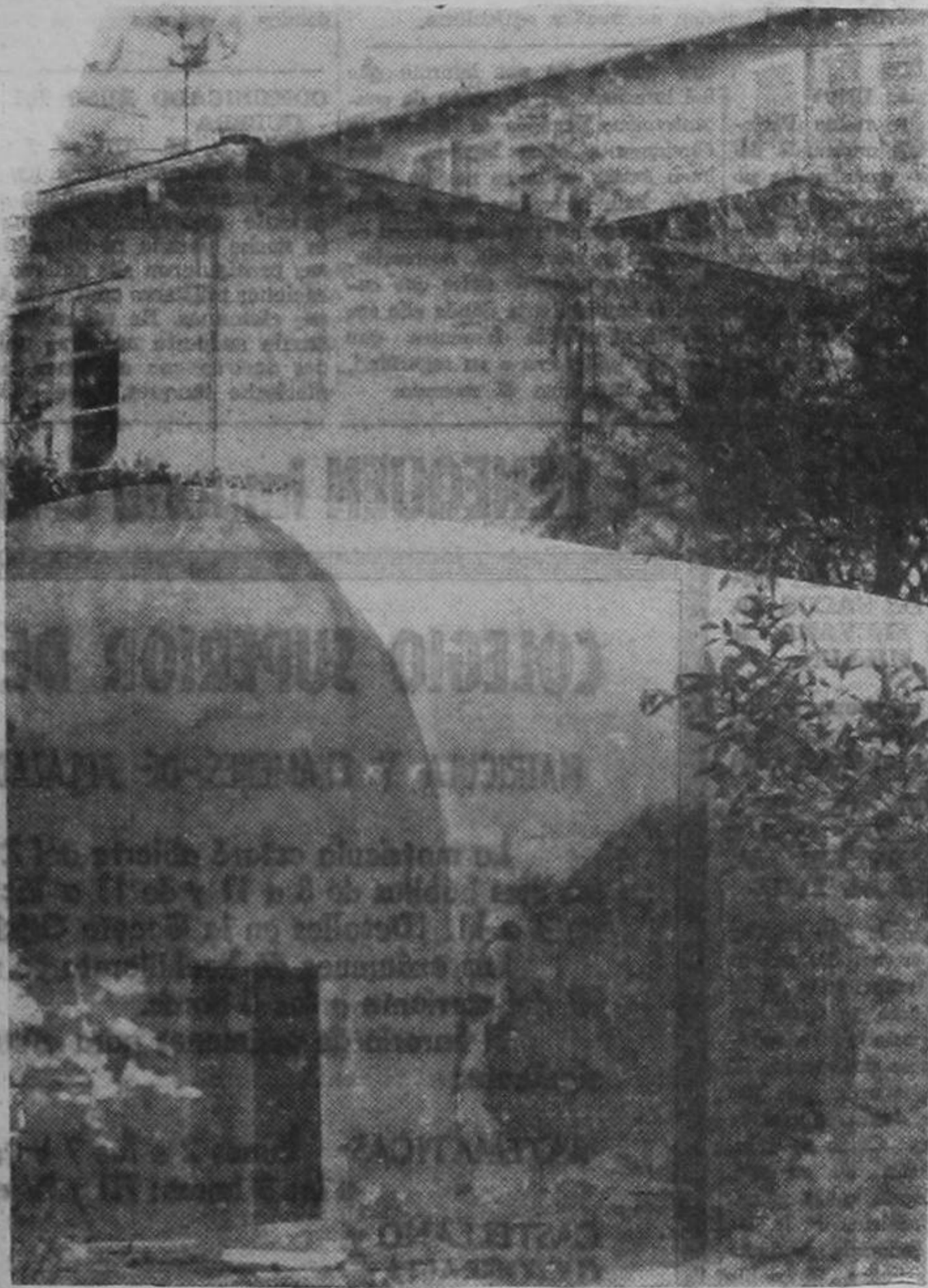
Un residente de San Diego, en California, edificó este refugio antiaéreo en el jardín de su casa. Está construido de hormigón armado y en su interior tiene todas las comodidades modernas.