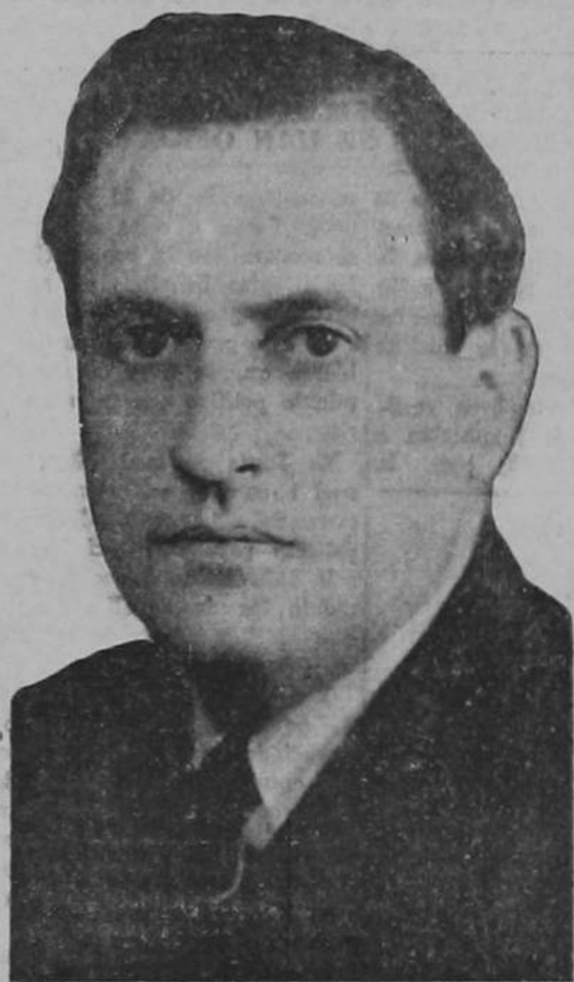
Excmo. Sr. Dr. Don Rafael Angel Calderón Guardia, Presidente de la República

CUMPLEAÑOS DEL EXCMO. SR. PRESIDENTE DE LA REPUBLICA