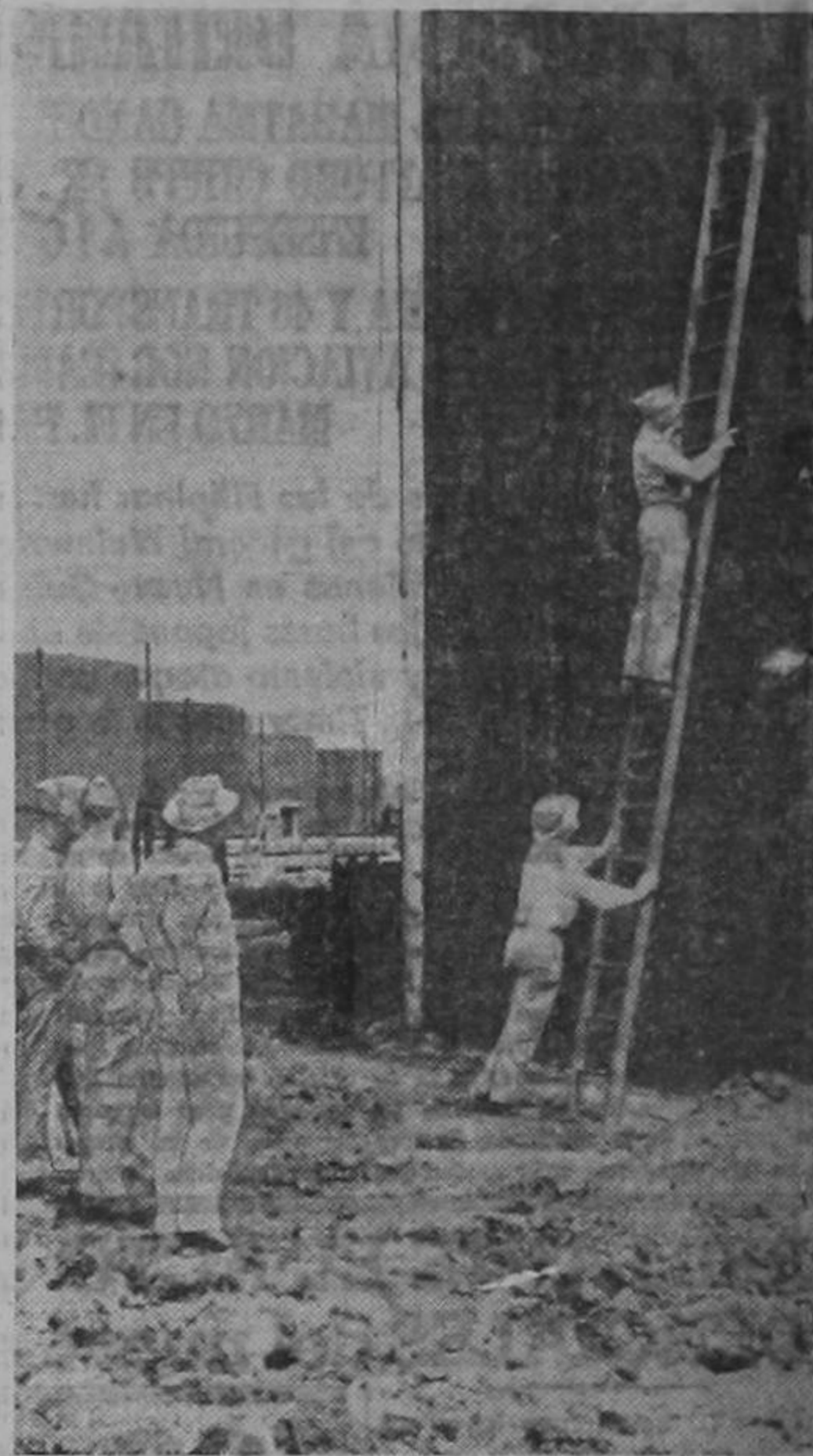
Oficiales del Ejército de los Estados Unidos inspeccionan los daños causados en un tanque de petróleo (flecha) en la isla de Aruba, cerca de las costas de Venezuela, por el ataque submarino reciente.

A TODAS AQUELLAS PERSONAS INTERESADAS EN CURSAR LOS ESTUDIOS DE