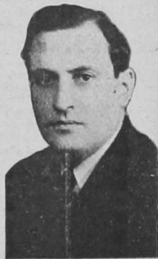
Doctor Calderón Guardia

Informa la prensa matutina del viaje realizado por el Presidente Dr. Calderón Guardia a La Cruz, frontera norte, ayer en las primeras horas de la mañana. (PASA a la Pág. SIETE)