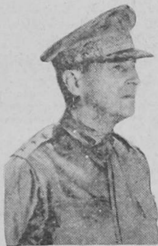
General MAC ARTHUR

En el seno de las organizaciones demócratas se ha lanzado la iniciativa