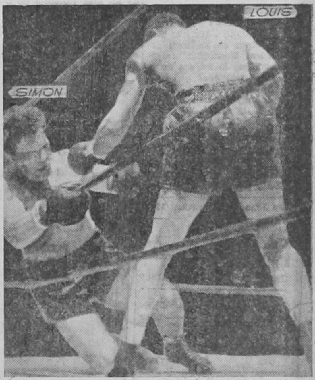
Joe Louis, el campeón mundial de peso completo, acaba de desembarcar uno de sus más poderosos golpes sobre el cuerpo de Abe Simon, aspirante, durante el encuentro que ambos sostuvieron recientemente en el Madison Square Garden, y en el que salió vencedor nuevamente el Bombardero de Detroit, a los 16 segundos después de haber comenzado el sexto asalto de la pelea señalada a quince