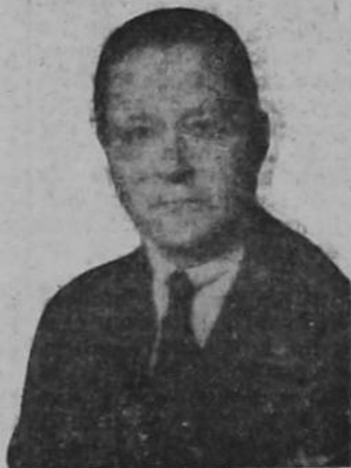
S. E. Mr. ARTHUR BLISS LANE, embajador de los Estados Unidos de Norte América

El Embajador de los Estados Unidos de Norte América en Colombia pasará por Costa Rica