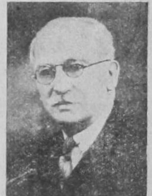
Don JULIO ACOSTA

expresidente de la república, don Julio Acosta García, para hacer con él algunos comentarios políticos. Pero el repórter salió defraudado en sus esperanzas. El señor gerente de la Caja Costarricense del Seguro Social se negó en redondo a contestarnos ninguna pregunta sobre el momento político. Más bien, entre (PASA a la Pág. TRES)