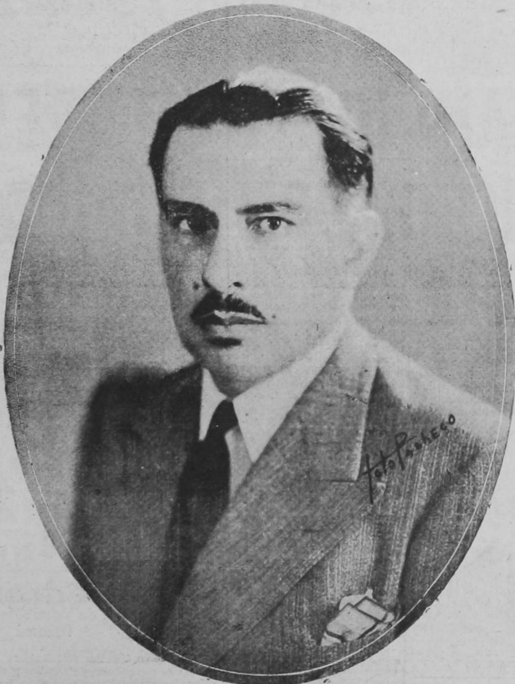
Licenciado don TEODORO PICADO