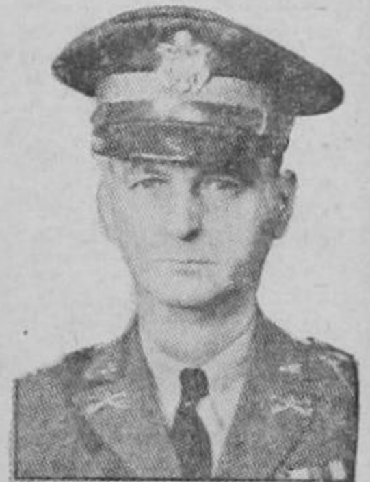
GENERAL WAINWRIGHT quien ratifica que Corregidor se defenderá hasta el fin

La noticia tiene interés grande y augura para Alajuela una nueva y positiva fuente de riqueza.