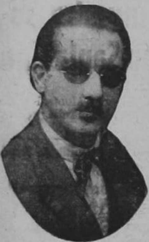
Lic. don ROGELIO SOTELA

Con destino a los Estados Unidos de Norte América salen en estos días el poeta nacional Lic. don Rogelio Sotela y su bella señora esposa doña Amalia Montagné de Sotela. El Lic. Sotela ofrecerá una serie de conferencias en aquel país. LA RAZON le adelanta su cordial saludo de despedida.