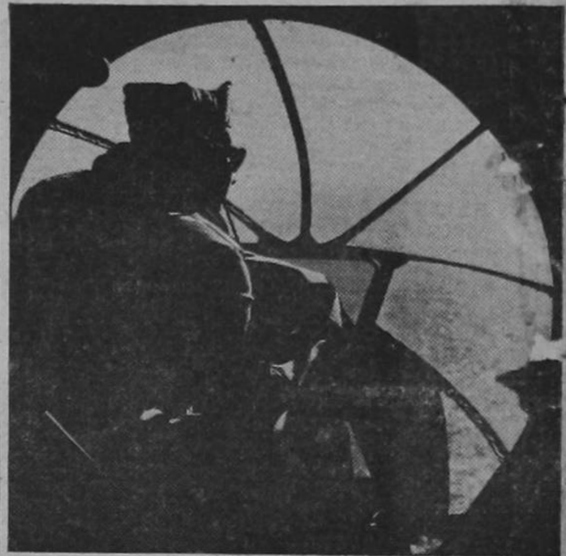
Allá lejos en el Océano Pacífico, el bombardero de una "Fortaleza Aérea" del Ejército de los Estados Unidos escurridiña el horizonte en acecho del enemigo. Los embarques del Eje han sufrido fuertes reveses, gracias a la precisión de los bombardeos por medio de la mundialmente famosa mira de bomba que usa la Fuerza Aérea de los Estados Unidos.