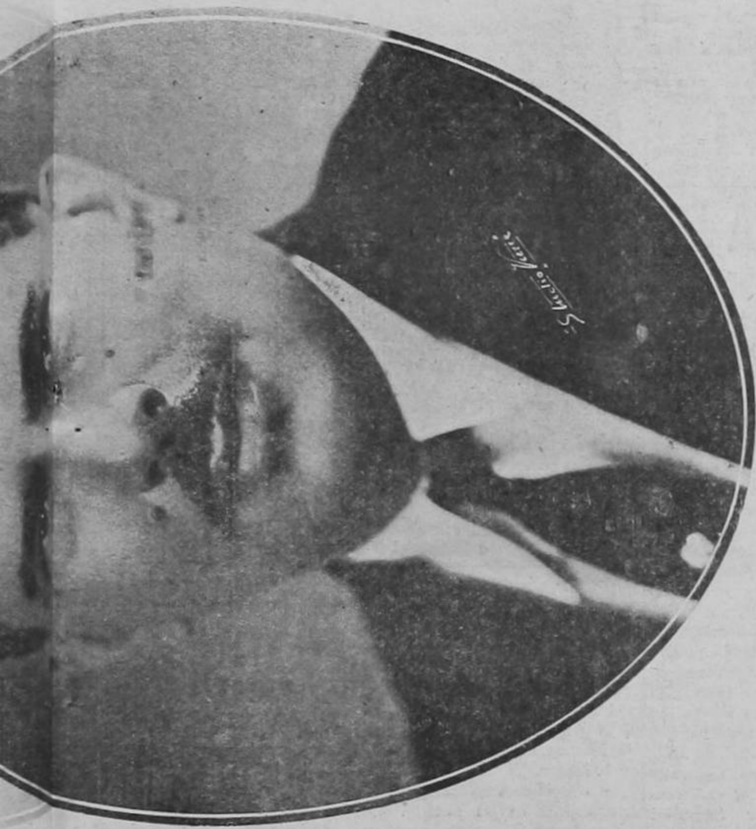
Lic. don TEODORO PICADO,

reelecto ayer, por 35 votos, Presidente del Congreso Constitucional. CANDIDATURA PRESIDENCIAL PARA EL PERIODO 1944 - 1948