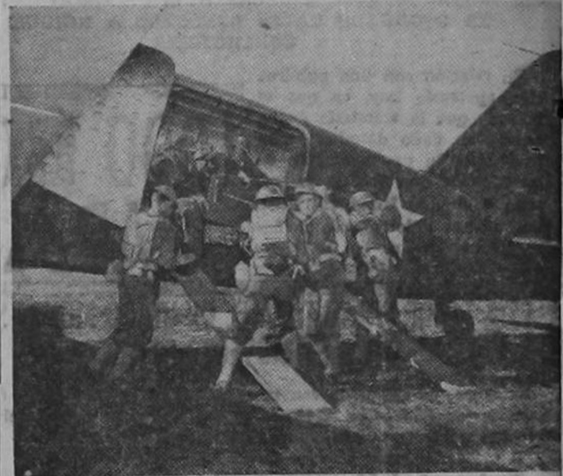
En esta fotografía aparecen tropas del Ejército de los Estados Unidos descargando un cañón de 37 mm, el cual llegó en un avión de transporte. Numerosas unidades del Ejército de los Estados Unidos han sido adiestradas en la ejecución de movimientos rápidos de ofensiva, cuyos resultados dependerán de la rapidez con que pueden llegar al frente tropas, cañones, y municiones, llevados por armadas de aviones transporte.

CAÑONES Y ARTILLEROS LLEVADOS POR LA VIA AÉREA