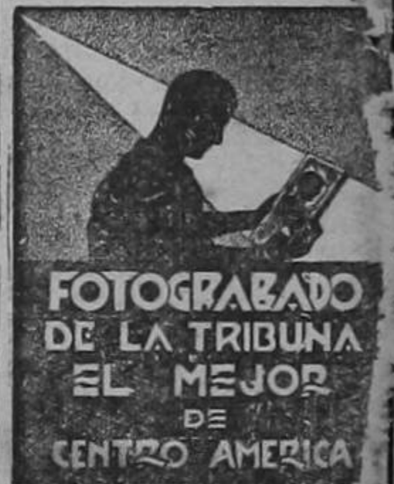
FOTOGRAFADO DE LA TRIBUNA EL MEJOR DE CENTRO AMERICA

LA FLOTA RUSA BOMBEEA A LOS ALEMANES LA PENINSULA ADE KER MOSCU, 16. UP. — En Crimea se continúa combatiendo fuerosamente en toda la península de Kerch y que la guarnición de Sebastopol ha emprendido ataques contra las líneas alemanas en varios puntos a fin de traer a parte de las fuerzas amigas que operan en la región. La ofensiva nazi al entrar en sexto día, halla a las fuerzas alemanas abrumadamente superiores después de haber perforado las líneas soviéticas, abriendo camino hacia el estrecho y trayendo de despejar la península tropas enemigas. Aunque no sabe de que los alemanes han sido detenidos en ese sector, cree en esta capital que la ciudad de Kerch continúa resistiendo y que las unidades de la rusa del mar Negro bombardean intensamente las posiciones enemigas.