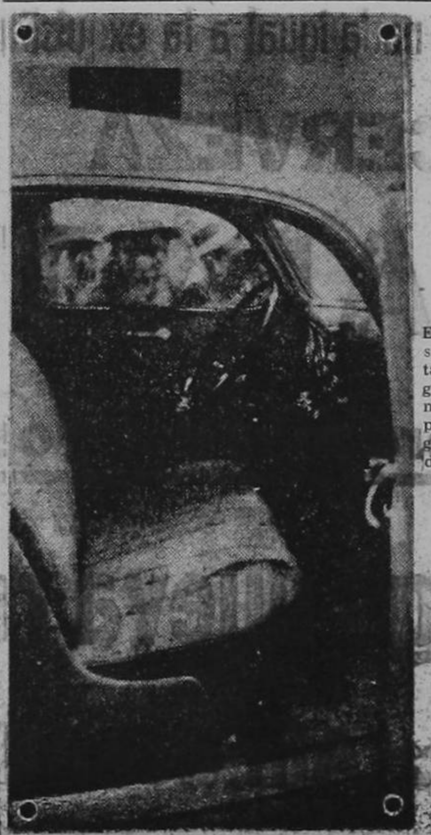
El cupé en que se suicidó Lolita Tellez fotografiado pocos momentos después de recogerse el cadáver de la hermosa bailarina.

NUEVA YORK, 19 UP. — Ayer comenzaron a hacerse efectivos por el tiempo que dure la guerra los precios máximos para miles de artículos. Los comerciantes pasieron a la vista grandes carteles en los que se especifican los precios máximos para miles de artículos de acuerdo con lo establecido por la repartición gubernamental respectiva.